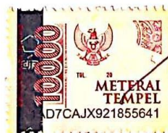
Rofi Rudiawan NIM.18312110