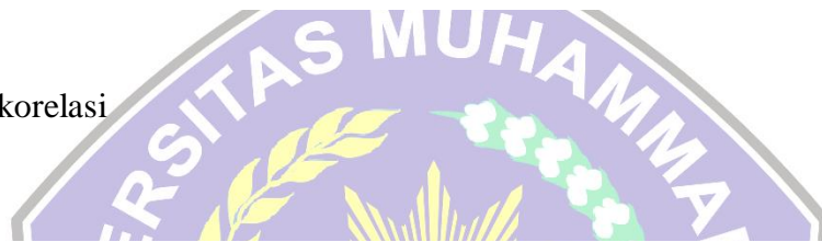
Model Summary b