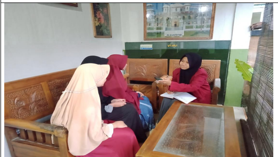
Foto Kegiatan Wawancara Dengan Santri PPTQ Ainul Mardhiyyah