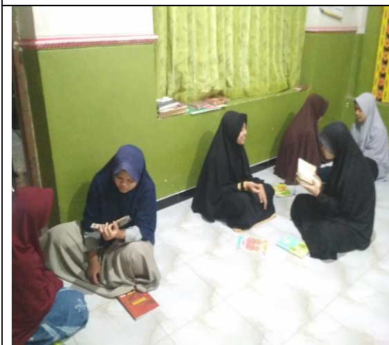
Foto Kegiatan Partenran sesame Santri