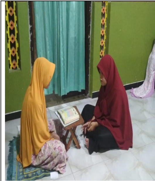
Foto Tasmi' di setorkan ke Pengampu tahfidz