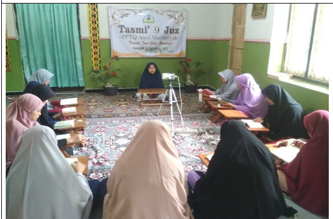
Foto Kegiatan Tasmi' di halaqoh Besar