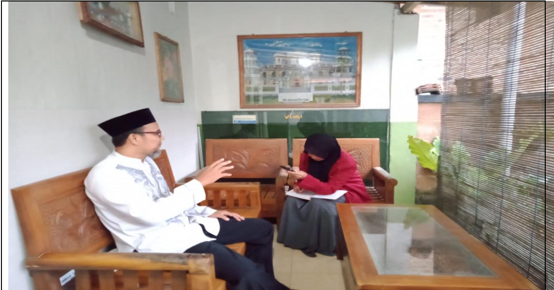
Foto Kegiatan Wawancara dengan Mudir PPTQ Ainul Mardhiyyah