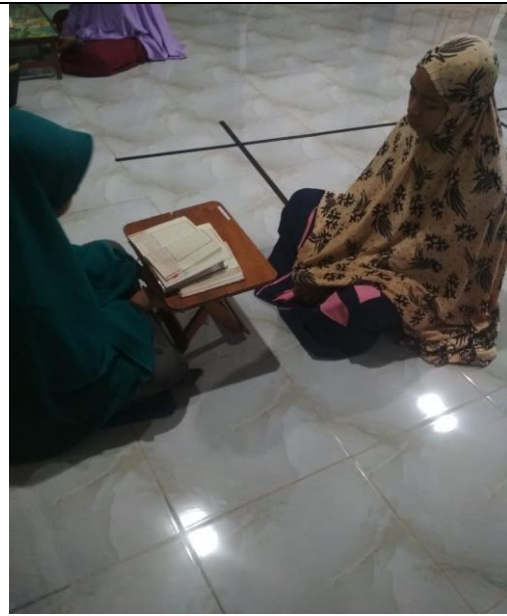
Foto Tasmi' di setorkan ke Pengampu tahfidz