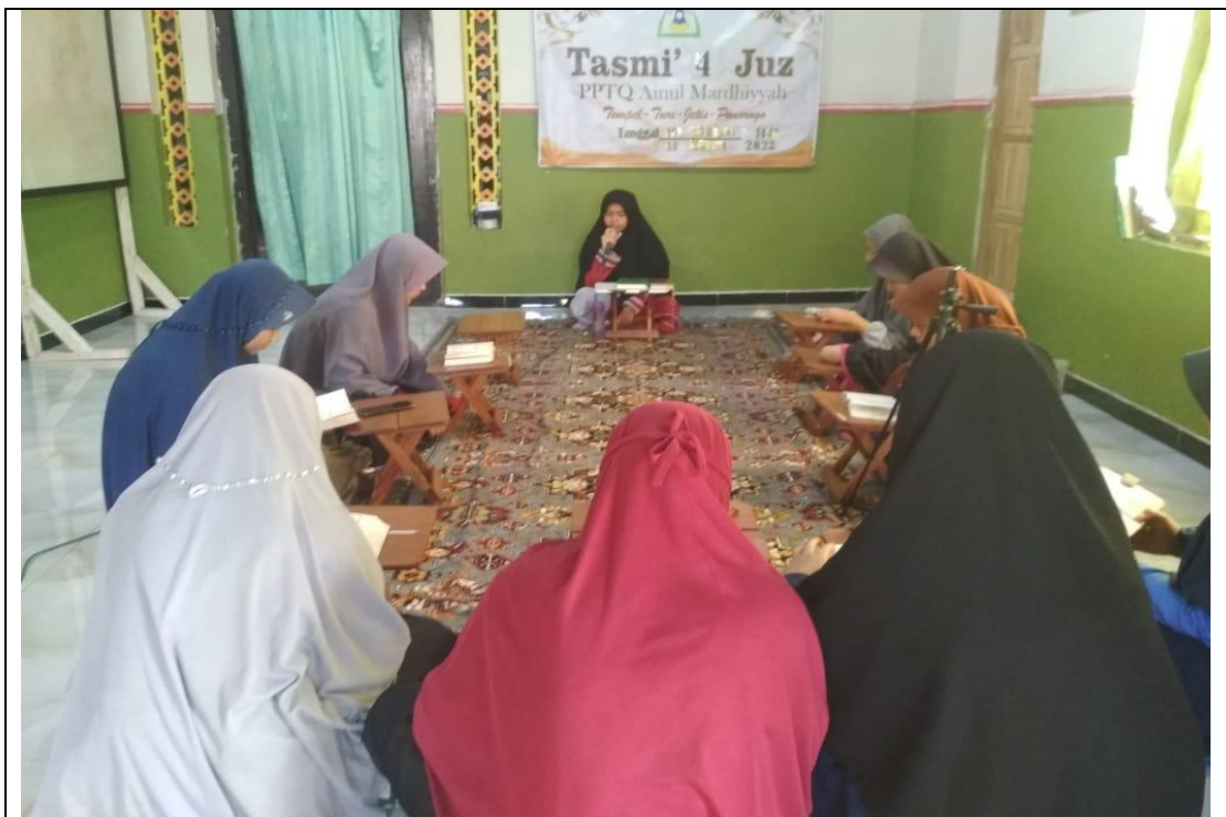
Foto Kegiatan Tasmi' di halaqoh Besar