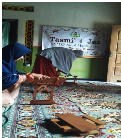
Foto Ustadzah mempersiapkan fasilitas sebelum tasmi'