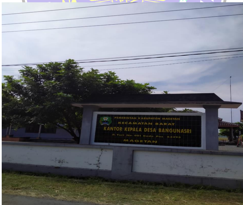
(Kantor Kepala Desa Bangunasri)