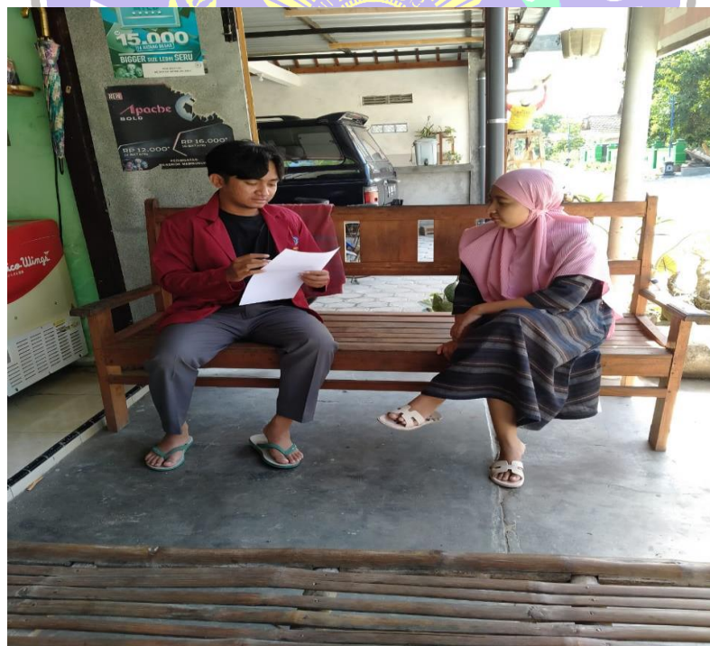
(wawancara dengan informan)