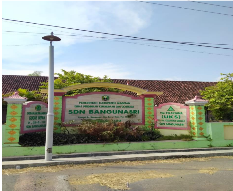
(sekolah dasar bangunasri)