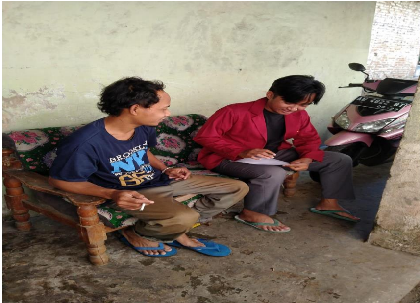
(wawancara dengan informan)