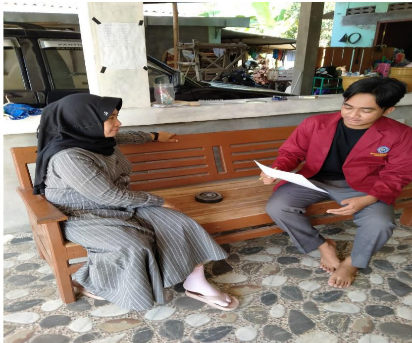
ER AD (wawancara dengan informan)