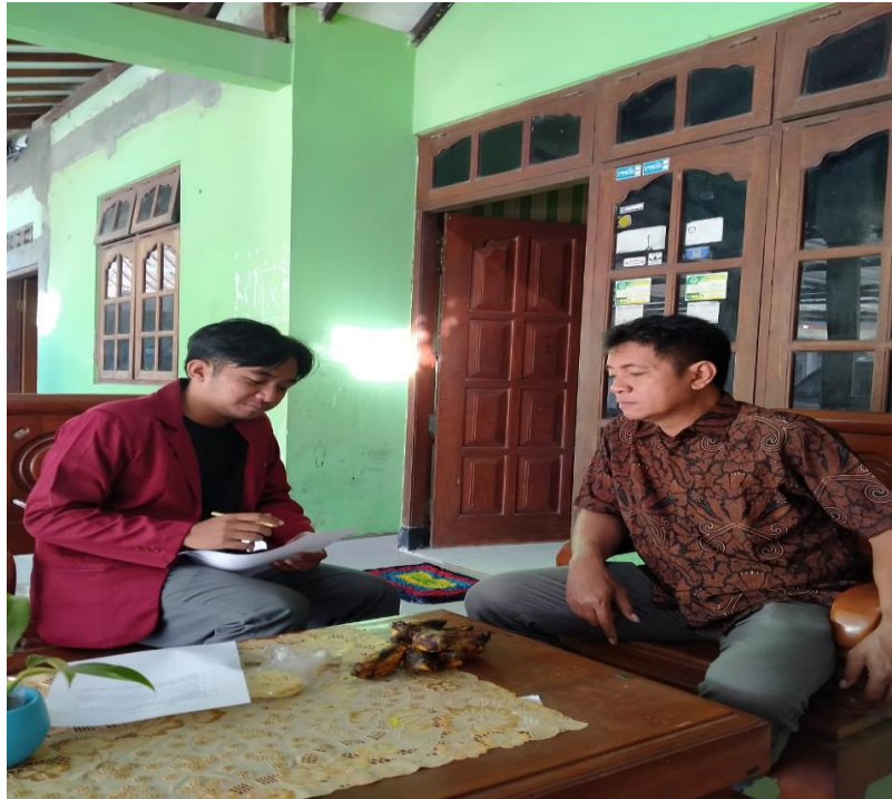
(wawancara dengan informan)