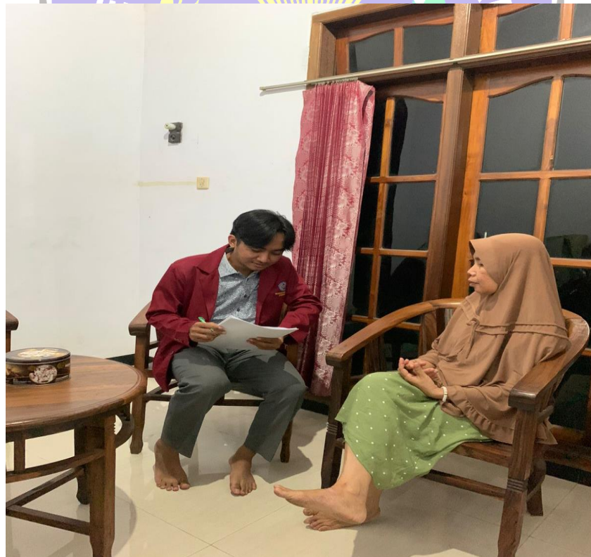
(wawancara dengan informan)