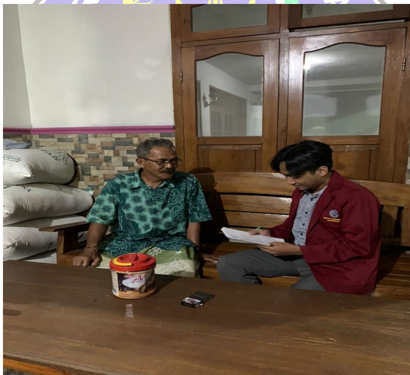
(Wawancara dengan informan)