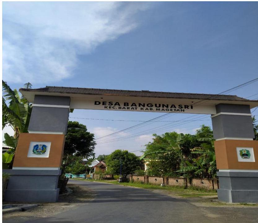
(Gapura masuk Desa Bangunasri)