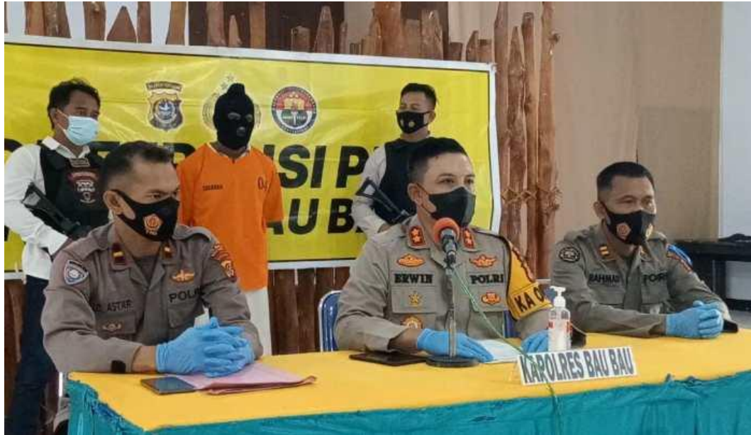
Gambar 5 Berita Hukum Kriminal