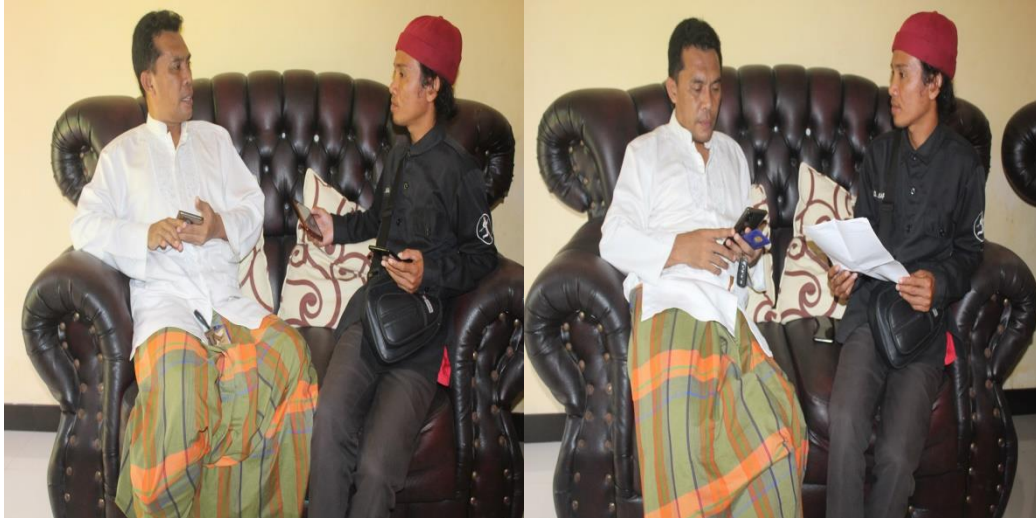
Gambar 1 wawancara Informan I