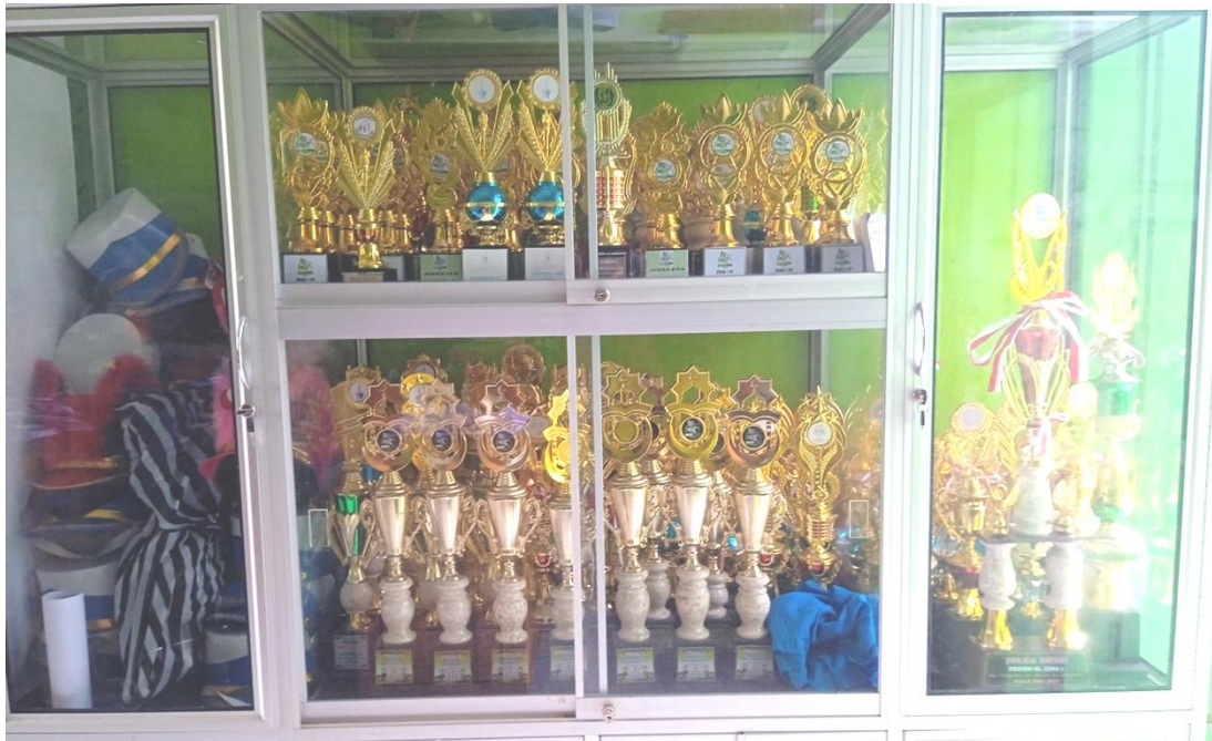
Prestasi Siswa Sebagai Output Pelaksanaan 5R