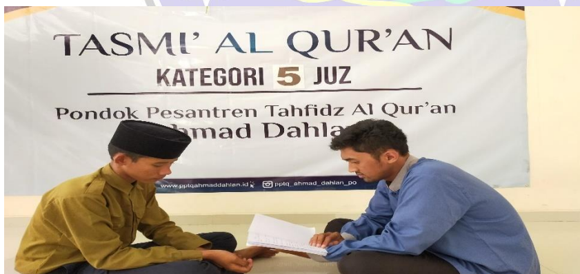
Gambar 3.3 Wawancara Santri PPTQ