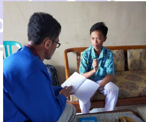
Gambar 4.3 Wawancara Siswa MBS (3) Gambar 4.4 Wawancara Siswa MBS (4)