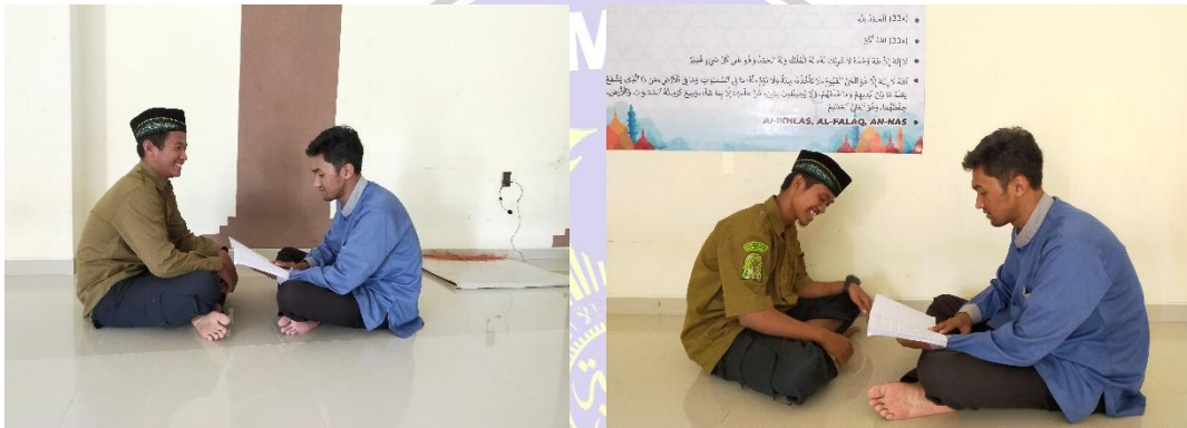
Gambar 3.1 Wawancara Santri PPTQ (1) Gambar 3.2 Wawancara Santri PPTQ (2)

Topik Dokumentasi : Dokumentasi dan Wawancara Informan Santri