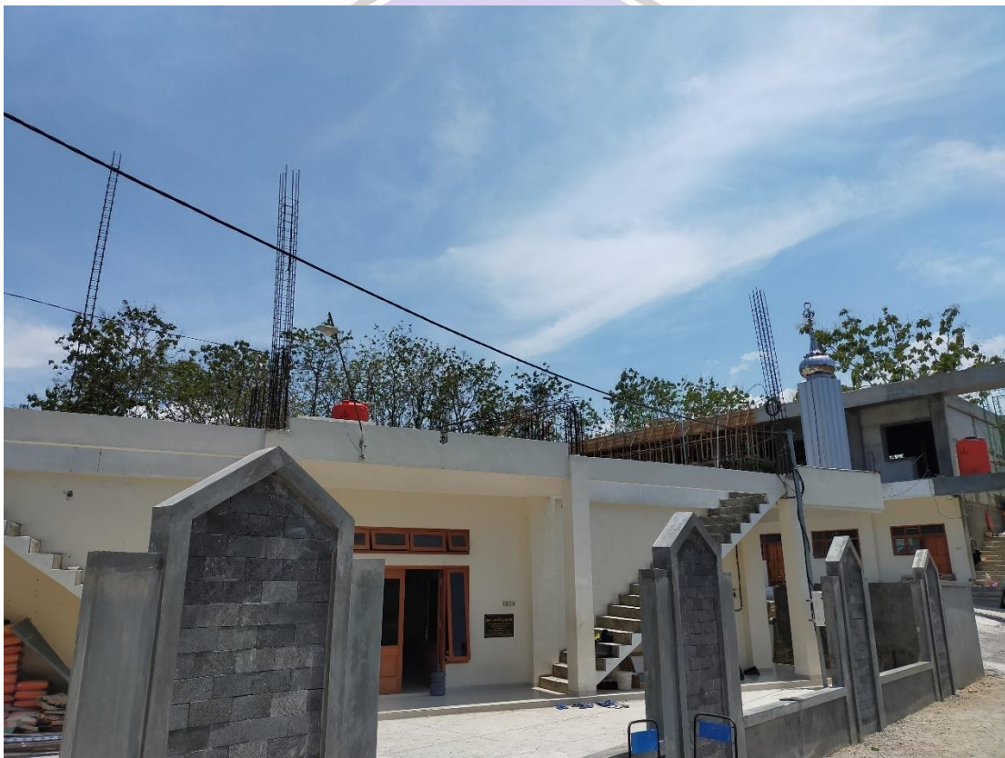
Gambar 1.1 Gedung Pesantren Ahmad Dahlan Proses Renovasi

Topik Dokumentasi : Gedung Pesantren Ahmad Dahlan Ponorogo