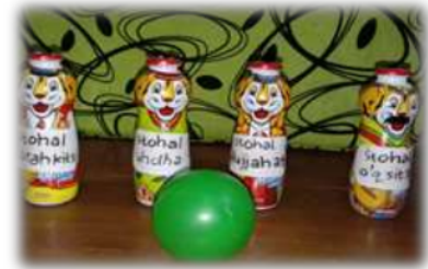
Gambar 4. Permainan Bowling dari Botol Bekas Minuman Susu Anak