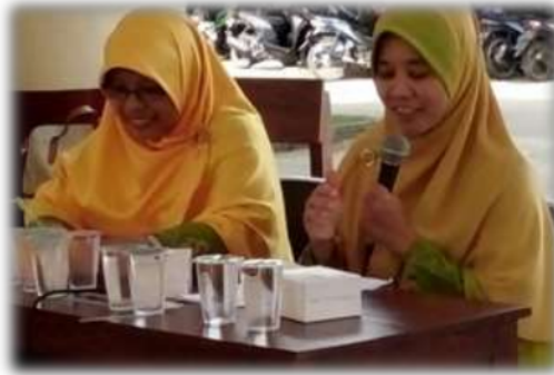
Gambar 1. Penyampaian Materi oleh Pemateri

point; (2) contoh alat permainan edukatif (APE) menggunakan barang bekas peminatan pemateri dalam bentuk barang jadi; dan (3) Media untuk praktik sebagai penerapan dalam pembuatan alat permainan edukatif (APE) menggunakan barang bekas peminatan, yang terdiri dari aqua gelas, kaleng susu, botol minuman, dan bambu bekas.