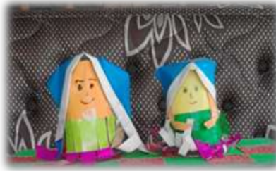
Gambar 3. Boneka Sandiwara dari Bekas Gelas Aqua