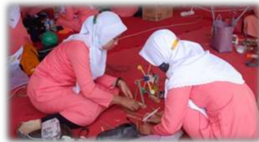
Gambar 5. Proses Pembuatan alat peraga edukatif