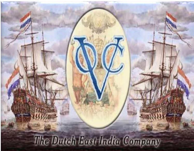
Gambar 1.4 Masa Kolonial Belanda

Pada tahun 1755 dengan Perjanjian Giyanti, VOC memecah Mataram menjadi dua kekuasaan yaitu Kesultanan Yogyakarta dan Kasunanan Surakarta. Tahun 1757/1758 VOC memecah Kasunanan Surakarta menjadi dua daerah kekuasaan yaitu Kasunanan Surakarta dan Mangkunegaran. Kesultanan Yogyakarta juga dibagi dua menjadi Kasultanan