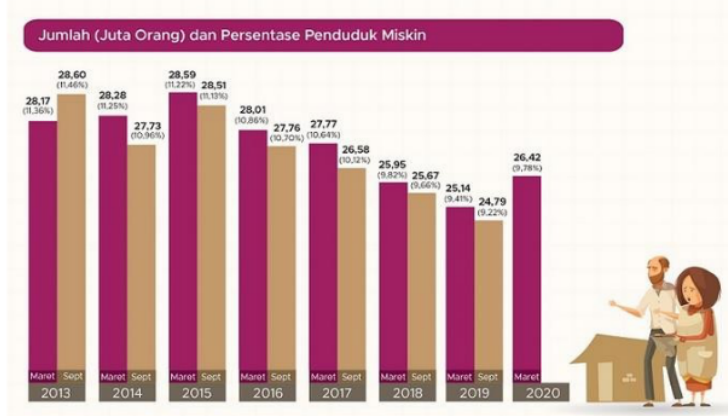
Grafik 1 Profile Kemiskinan di Indonesia Maret 2020