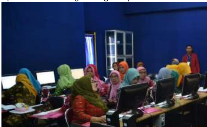
Gambar 3. Pelaksanaan Sosialisasi SAKO

Pada akhir acara pelatihan kegiatan ini yaitu bagian janya jawab. Pada tahap ini banyak dari partisipan memberikan pertanyaan yang berhubungan dengan cara membuat password dengan benar serta apa yang harus dilakukan ketika computer tidak ada respon. Setelah sesi tersebut berakhir, pemateri menyampaikan penilaian post-test, untuk mengetahui tingkat pengetahuan peserta terhadap materi yang disampaikan selama mengikuti kegiatan pelatihan ini.