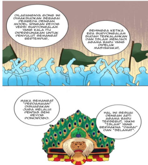
Gambar 3. Nilai Budi Luhur Seni Reyog Ponorogo