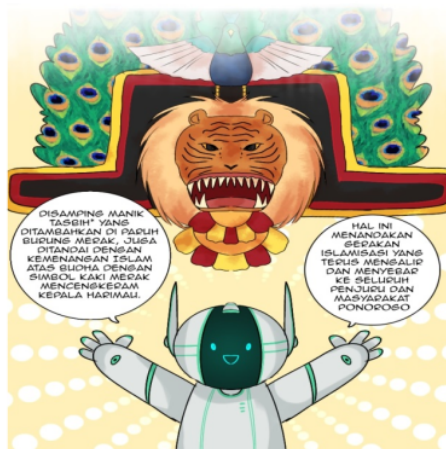
Gambar 4. Nilai Pendidikan Jasmani dan Rohani Seni Reyog Ponorogo