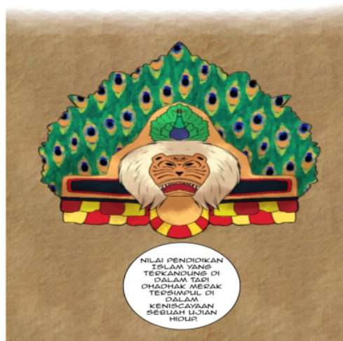
Gambar 2. Nilai Pendidikan Seni Reyog Ponorogo