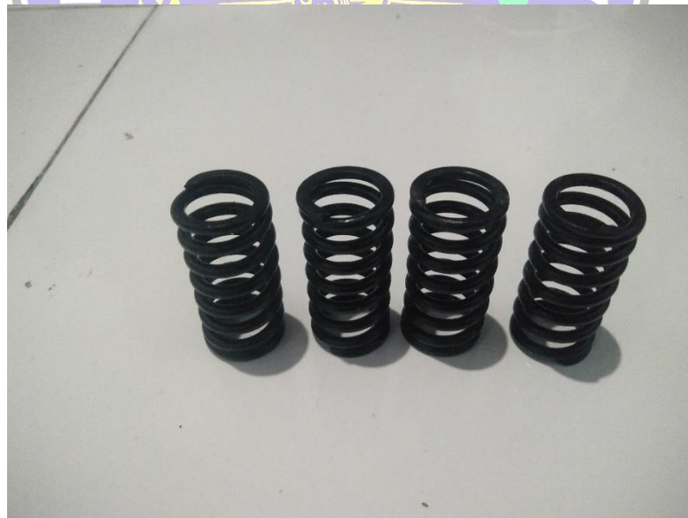
Pegas kopling Rmg