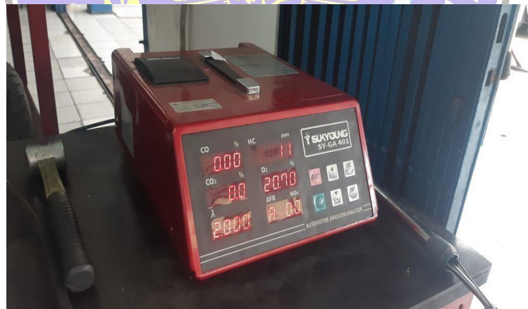
Alat uji emisi gas baung