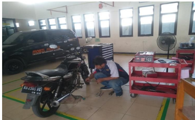
Pembongkaran pegas kopling pada emisi gas buang