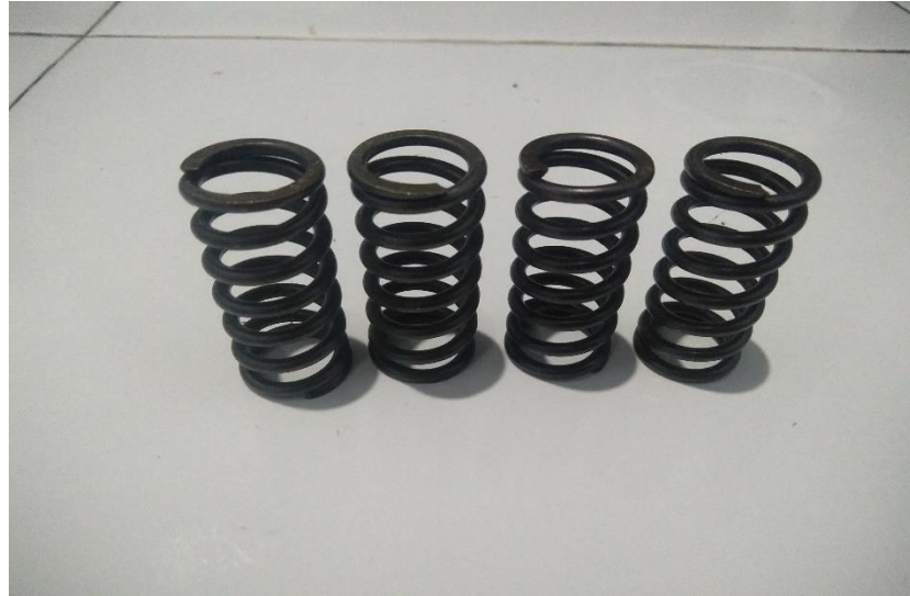
Pegas Kopling Tdr