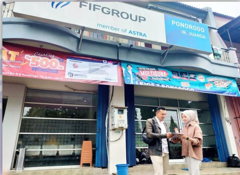
Sumber : PT. Federal International Finance 2022

Wawancara dengan karyawan PT. Federal International Finance Cabang Ponorogo bagian collector terkait dengan sistem informasi akuntansi kredit pada penagihan yang diterapkan oleh perusahaan