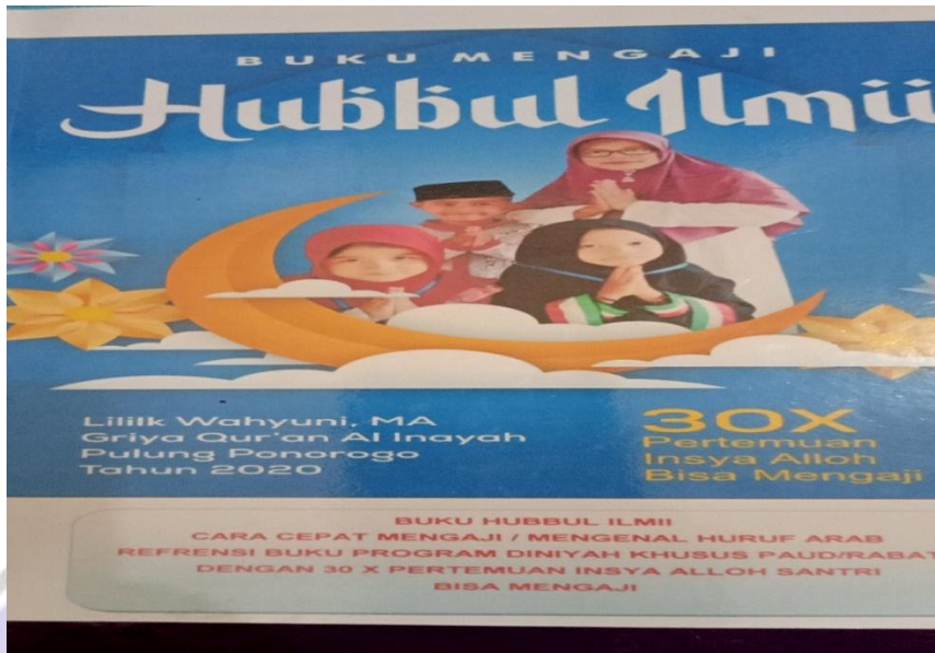
Gambar 3 Buku Hubbul Ilmii Mengaji