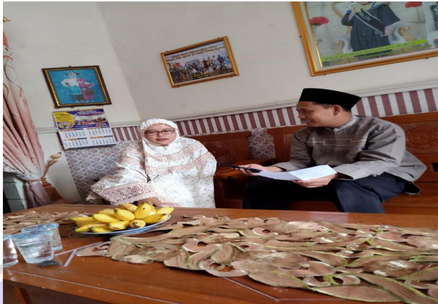
Gambar 5 Wawancara dengan direktur Griya Qur'an al-Inayah Pulung Ponorogo