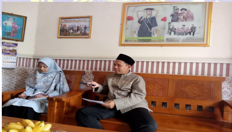
Gambar 6 Wawancara dengan Guru Griya Qur'an al-Inayah Pulung Ponorogo