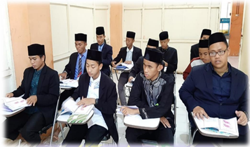
Foto 3: Kegiatan Pembelajaran kelas Santri Putra STID Al Furqon