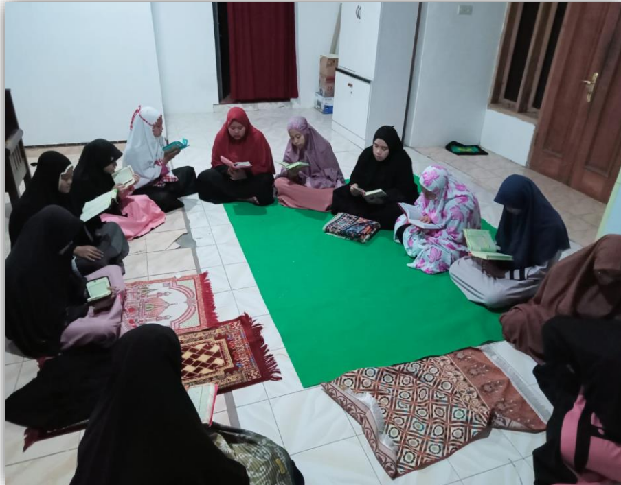
Foto 1: Kegiatan Tahfizh Santri Putri STID Al Furqon