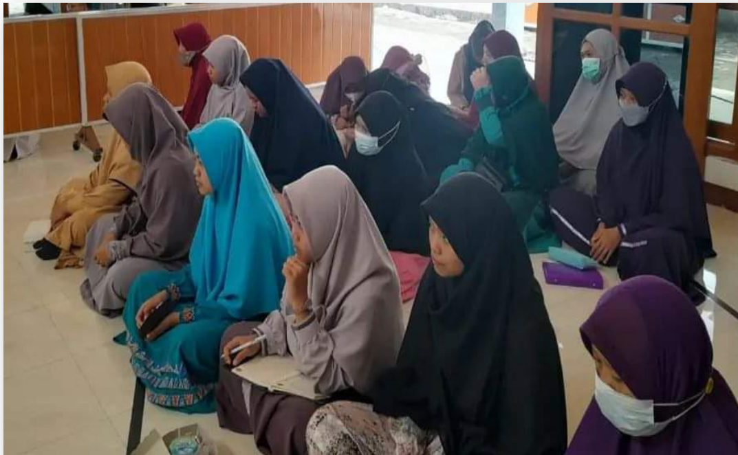
Foto 5 : Kajian Ahad pagi penguatan Adab oleh Ketua Yayasan Al Furqon