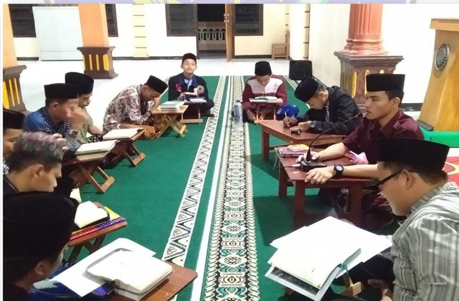
Foto 2: Kegiatan Tahfizh Santri Putra STID Al Furqon