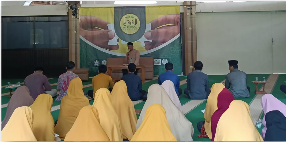
Foto 7: Kegiatan Kajian Adab untuk para Guru bersama pembina Yayasan Al Furqon