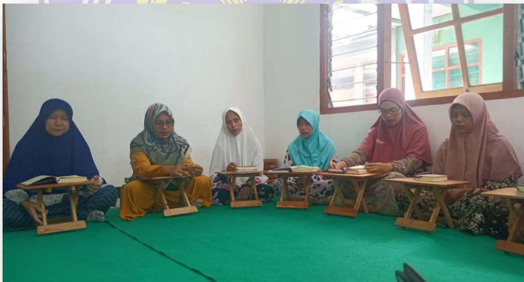
Foto 8: Pembinaan Tahsin al-Qur'an untuk masyarakat oleh santri STID Al Furqon