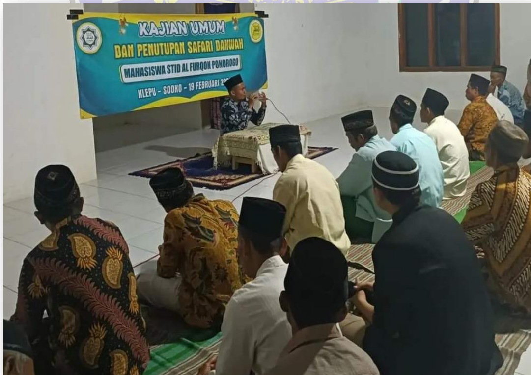
Foto 6 : Kajian bersama masyarakat diagendakan oleh santri sekaligus penutupan Rihlah Dakwah Santri