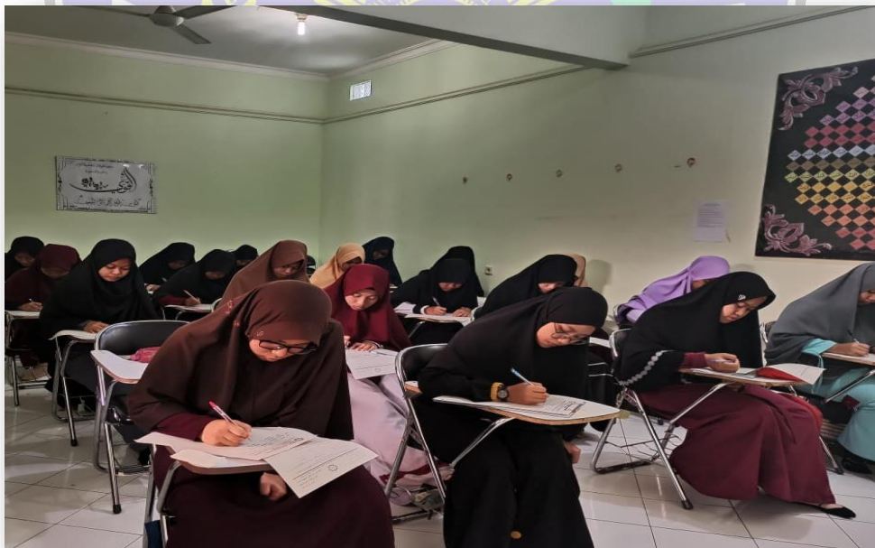
Foto 4 : Kegiatan Pembelajaran kelas Santri Putri STID Al Furqon