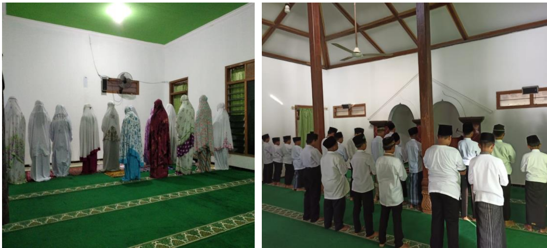
Foto 10: Integrasi Pembentukan Sikap Kemandirian melalui Pembinaan Spiritual Santri