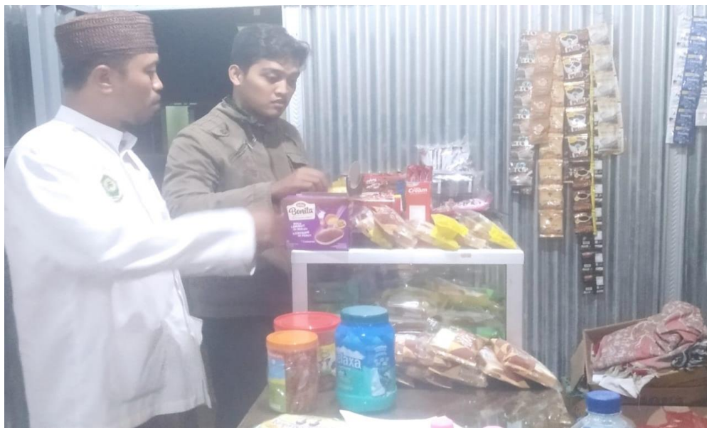
Foto 05: Wawancara dan observasi Pengelolaan Koperasi “Rizquna” Pondok Pesantren Roudlotut Tholibin Carangrejo