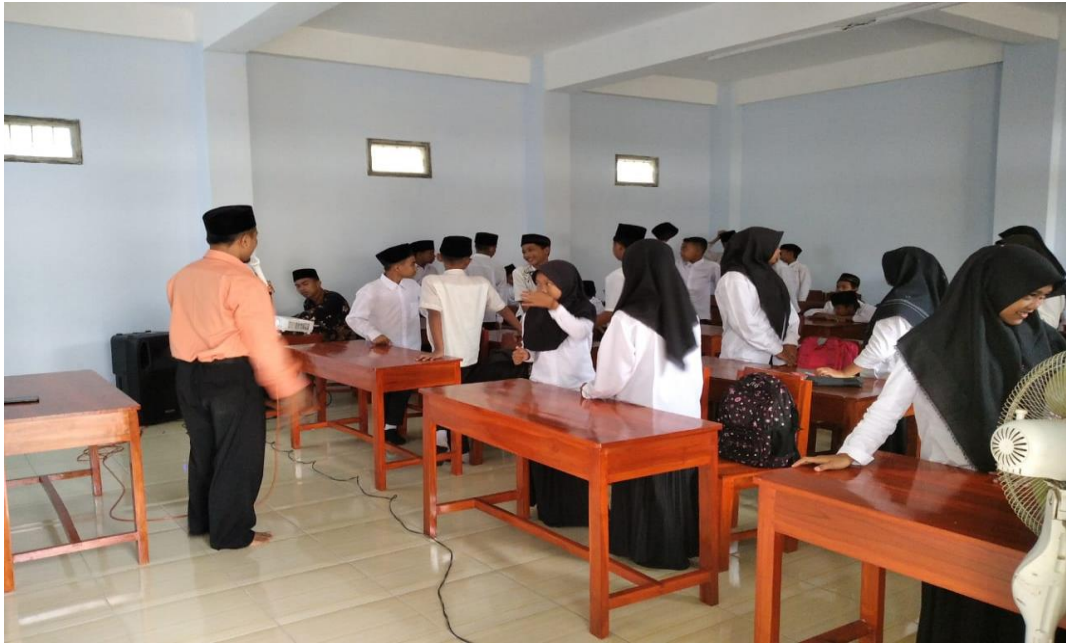
Foto 08: Integrasi Pembentukan Sikap Kemandirian melalui Pembelajaran Kepada Para Santri Pondok Pesantren Roudlotut Tholibin Carangrejo