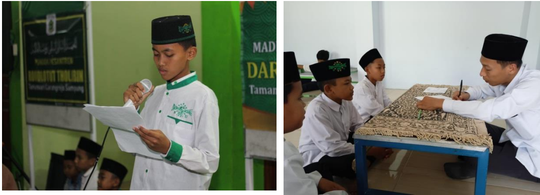
Foto 10: Integrasi Pembentukan Sikap Kemandirian melalui Giat Muhadloroh Santri