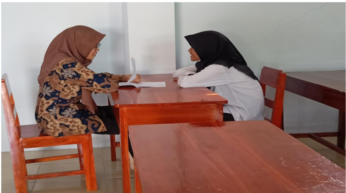
Foto 09: Integrasi Pembentukan Sikap Kemandirian melalui Pembinaan Santri Kepada Para Santri Pondok Pesantren Roudlotut Tholibin Carangrejo