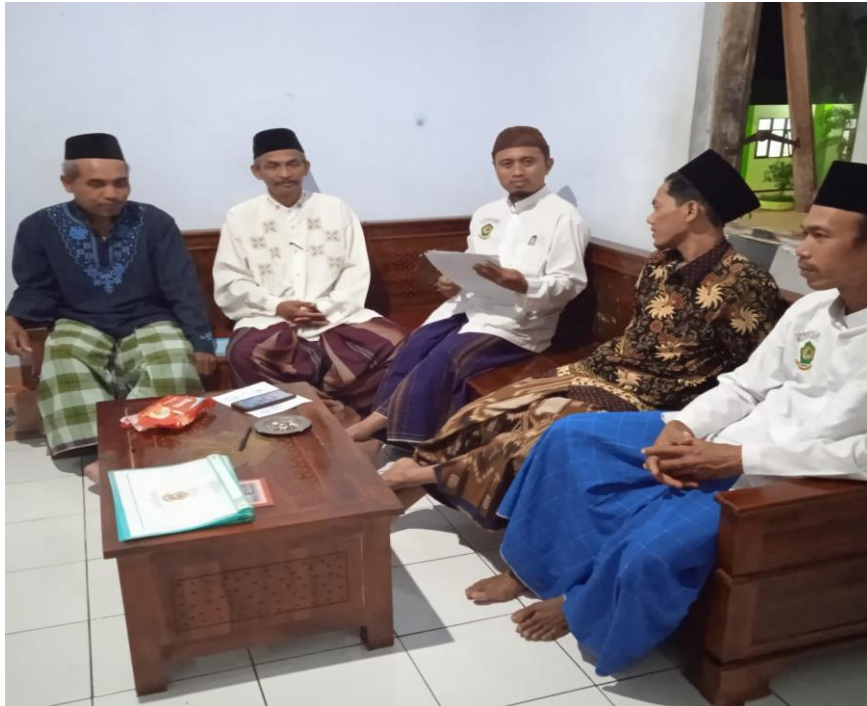
Foto 04: Wawancara dengan Lurah Pondok dan beberapa Pengurus Pondok Pesantren Roudlotut Tholibin Carangrejo