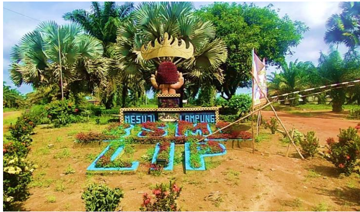
Gambar 5 Perusahaan Perkebunan Kelapa Sawit, PT. BSMI

Di Fajar Indah terdapat juga sebuah Perusahaan perkebunan kelapa sawit, yaitu PT. BSMI. Perusahaan tersebut juga banyak memperkerjakan masyarakat Desa Fajar Indah, yang di mana hal tersebut menjadi salah satu mata pencaharian masyarakat Desa.