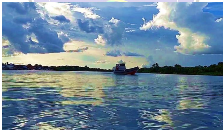
Gambar 2 Sungai Mesuji

Selain itu, Desa Fajar Indah adalah salah satu Desa di Provinsi Lampung yang berbatasan langsung dengan Provinsi Sumatera Selatan, dengan di tandai ikon perbatasan yakni Sungai Mesuji.