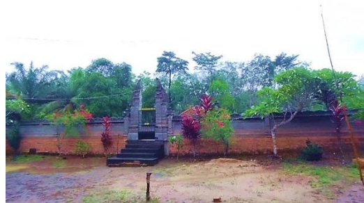
Gambar 6 Fasilitas Beribadah