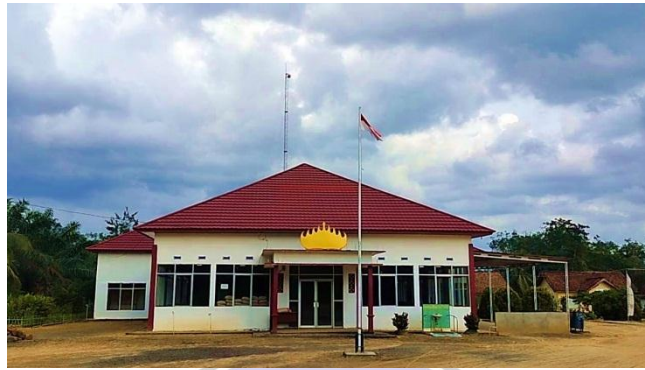
Gambar 9 Balai Desa Fajar Indah

Meninjau perkembangan Desa Fajar Indah pada saat ini, terbilang cukup mengalami kemajuan, mengingat Desa Fajar Indah terhitung Desa yang usianya masih muda.