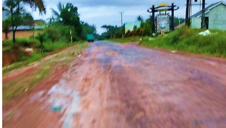
Gambar 3 Jalan Poros Kabupaten Akses Penghubung Ke Desa

Desa Fajar Indah terdiri dari 6 RK dan 14 RT dan jumlah penduduk lebih dari 1.800 jiwa, dengan luas wilayah sekitar 1.405,5 Hektare.