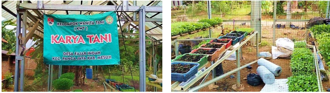
Gambar 11 Kelompok Wanita Tani (KWT)