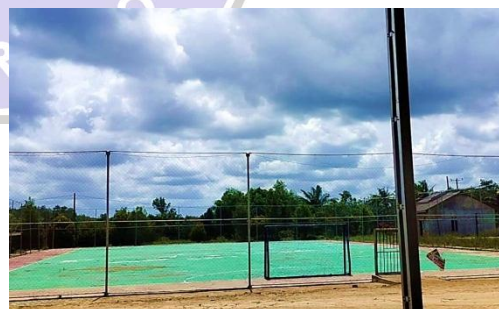
Gambar 10 Sarana Jalan dan Olahraga

Dan dalam bidang pemberdayaan manusia, salah satu contoh yang ada di Desa Fajar Indah, yakni Kelompok Wanita Tani (KWT). Kelompok tersebut beranggotakan ibu-ibu yang bergerak dalam sektor pertanian. Adapun tanaman yang di budidayakan berupa tanaman sayur mayur.