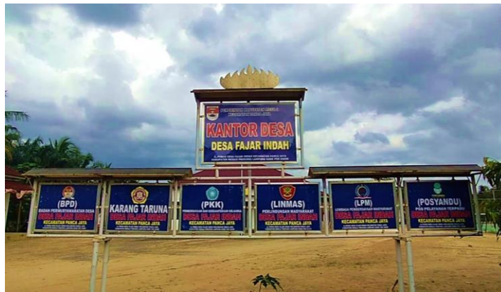
Gambar 1 Plang Informasi Desa Fajar Indah.

Desa Fajar Indah, adalah sebuah Desa di Kecamatan Panca Jaya, Kabupaten Mesuji, Provinsi Lampung. Desa Fajar Indah Terbentuk berdasarkan Peraturan Daerah Nomor 06 Tahun 2008. Desa Fajar Indah juga merupakan pecahan dari Desa Induk, yakni Desa Fajar Baru.