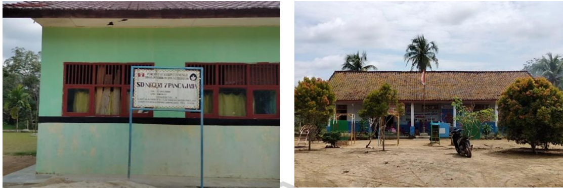
Gambar 7 Fasilitas Pendidikan

Lalu dalam aspek pendidikan, di Desa Fajar Indah juga terdapat satu Sekolah Dasar (SD) dan satu Taman Kanak-Kanak (TK), yang setiap tahun nya selalu menerima peserta didik baru.