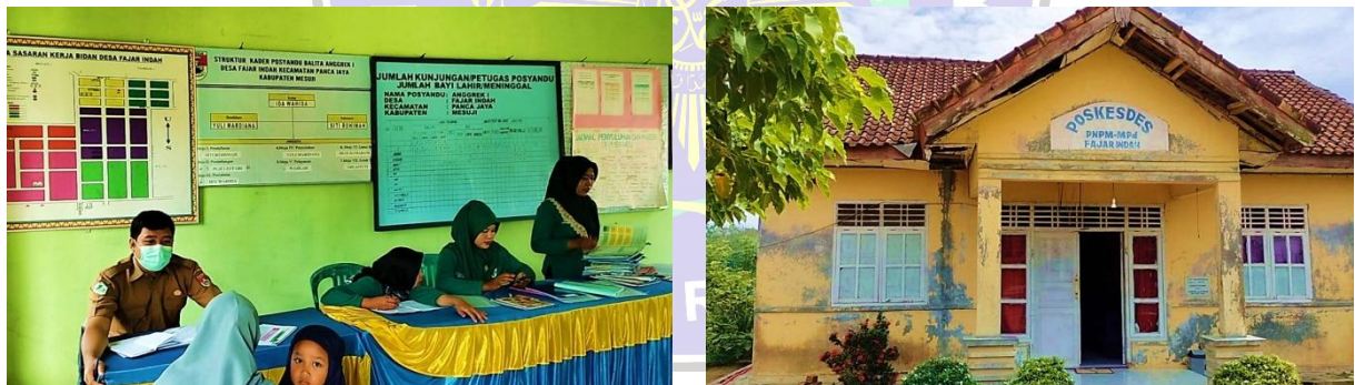
Gambar 8 Fasilitas Kesehatan

Selanjutnya dalam bidang kesehatan, di Desa Fajar Indah terdapat Poskesdes, yang pelayanannya di bantu oleh Bidan Desa. Di setiap bulan juga rutin dilakukan pelayanan cek kesehatan bagi warga Desa Fajar Indah.