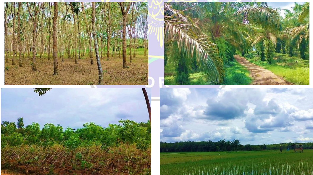
Gambar 4 Area Perkebunan dan Persawahan

Dengan luas wilayah tersebut, selain area pemukiman, sebagian wilayah Desa Fajar Indah terdiri dari area perkebunan, yakni perkebunan karet, kelapa sawit, dan singkong. Adapun wilayah persawahan, hanya sedikit keberadaannya.