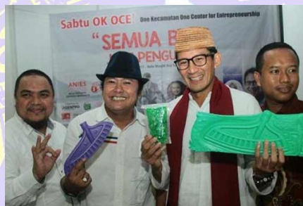
Gambar 4. 3 Pemberitaan di Media Sosial

Selain membuka peluang mitra sebagai strategi pengembangan bisnis, ia juga mendirikan anak perusahaan yang dikembangkan oleh putranya yang akan menjadi penerus usaha yaitu AKSATA (Aksi Kelola Sampah Kita). Aksata bergerak di pengumpulan sampah plastik bekerjasama dengan sekolah-sekolah. Dengan begitu semakin banyak peluang untuk mendapatkan bahan baku daur ulang sampah plastik, selain dari para pengepul yang dibina oleh bapak Mohammad Baedowy melalui PT Majestic Buana Group.