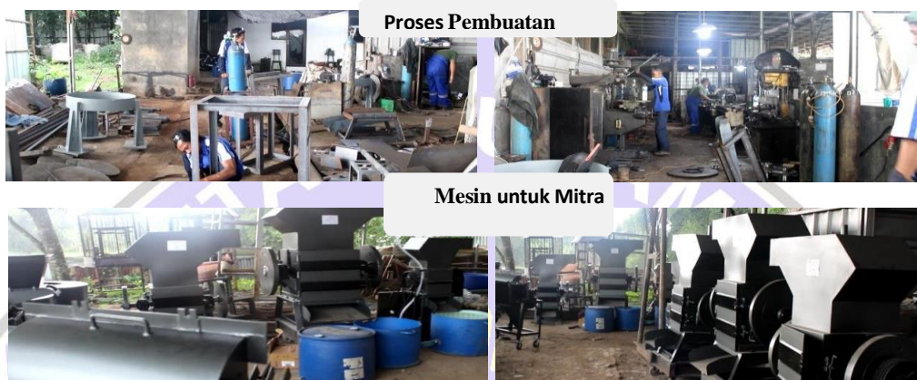
Gambar 4. 2 Pembuatan Mesin Khusus Mitra

oleh mitra yaitu mulai dari perakitan mesin, pelatihan, pembelian hasil cacahan dan garansi mesin selamanya. Harga mesin giling untuk daur ulang sampah yaitu Rp 28.000.000,- sampai Rp 55.000.000,- . Dan untuk harga mesin pembuatan lakop sapu dan paving block adalah Rp 200.000.000,- sampai Rp 300.000.000,-.