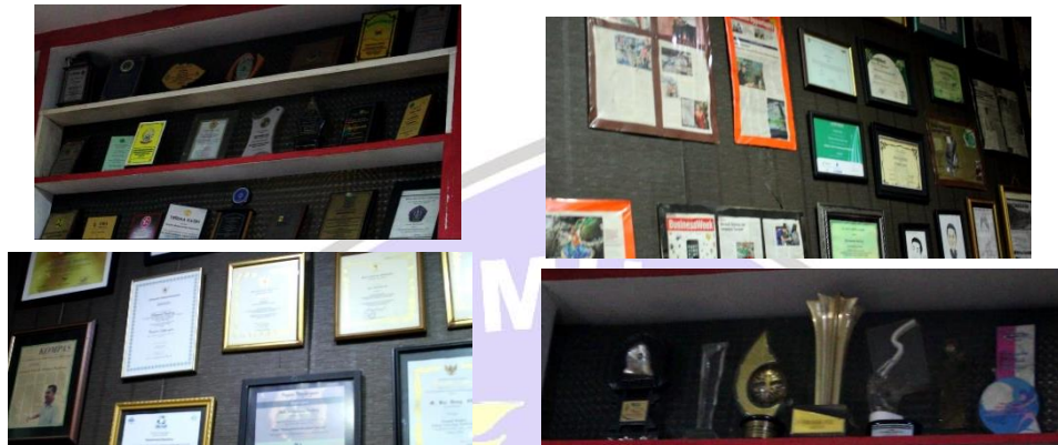
Gambar 4. 1 Piagam Penghargaan

yang ia dirikan berjalan dengan lancar dan sukses ke seluruh Indonesia hingga ekspor ke luar negeri (Guangzhou china). Bahkan sudah banyak mendapatkan penghargaan.