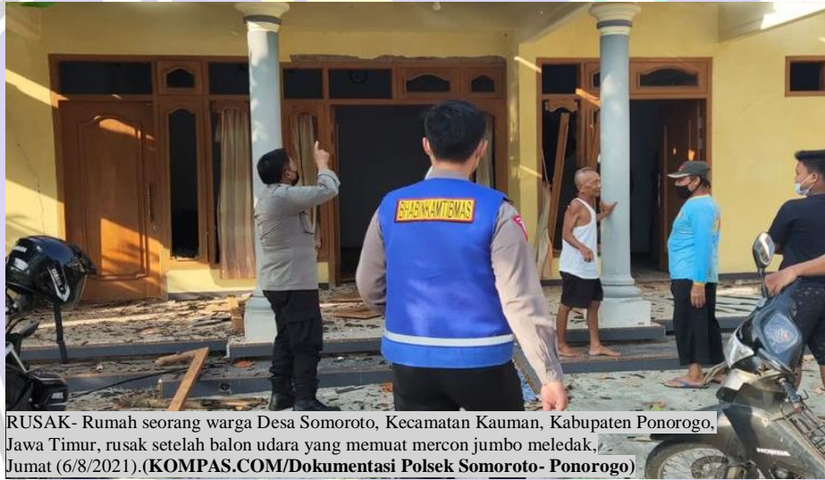
RUSAK- Rumah seorang warga Desa Somoroto, Kecamatan Kauman, Kabupaten Ponorogo, Jawa Timur, rusak setelah balon udara yang memuat mercon jumbo meledak, Jumat (6/8/2021).