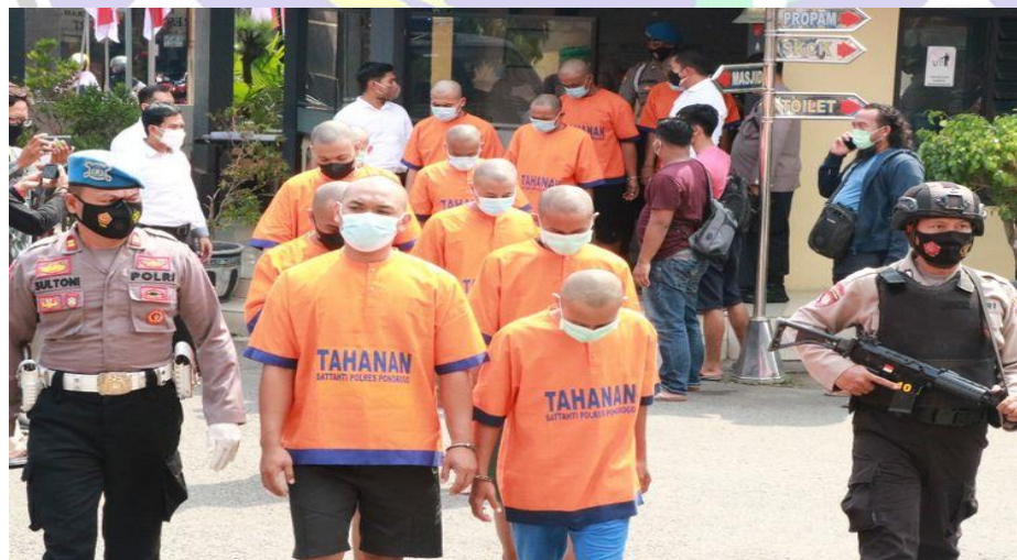
DIGELANDANG-Pembuat dan penerbang balon udara tanpa awak yang meledak hingga merusakkan empat rumah dan satu sekolah digelandang di Mapolres Ponorogo, Senin (9/8/2021).