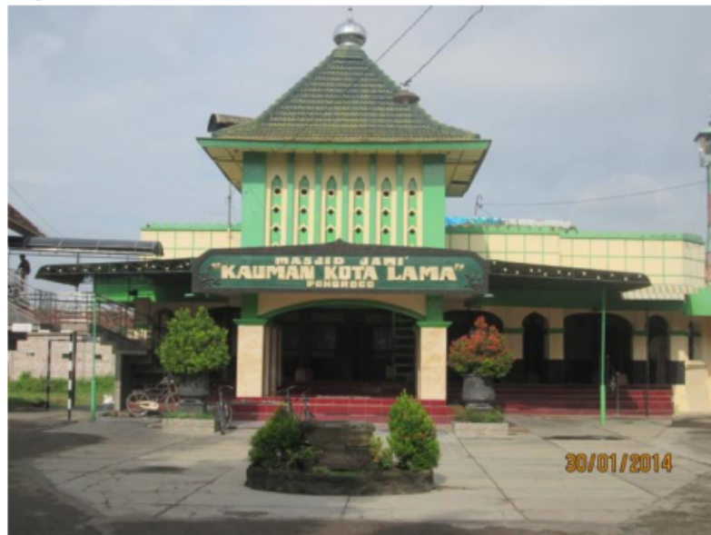
Gambar 3. 6 Masjid Kota lama salah satu peninggalan zaman dahulu yang lokasinya berada di desa Kadipaten