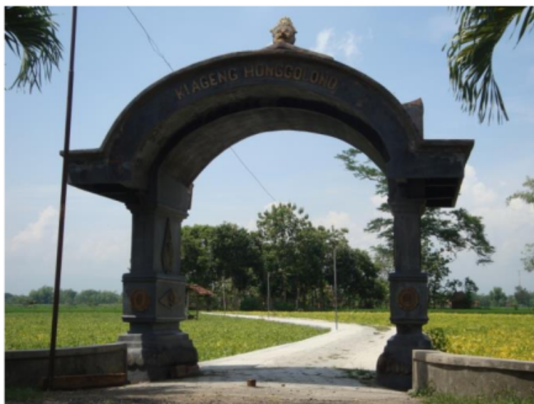
Gambar 3. 1 Gapuro Makam Warok Ki Ageng Honggolono