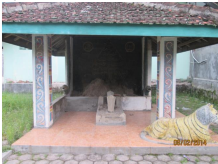
Gambar 3. 5 Makam Jayadipo yang terletak di desa Japan