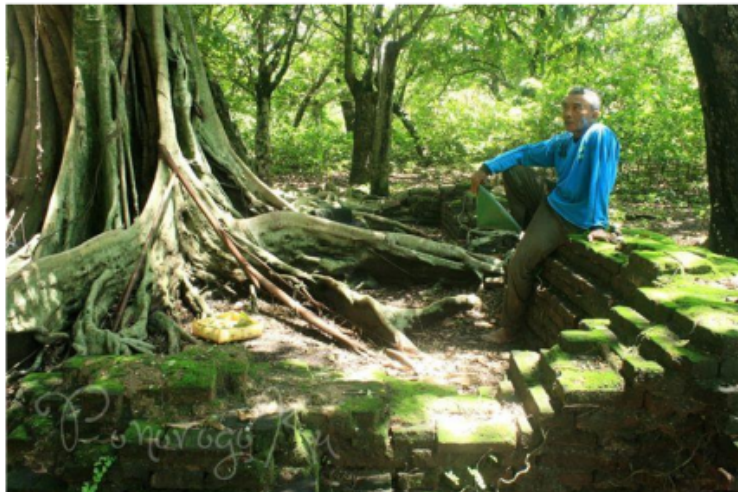
Gambar 3. 2 Lokasi Petilasan Sukosewu tempat Raden Katong bersama pasukan Istirahat di Sukorejo di lokasi ini ditemukan beberapa Peninggalan Alat Masak dan Beberapa candi.

Desa Mirah berasal dari nama Tokoh Kiai Ageng Mirah putra Kiai Ageng Gribig. Kiai Ageng Mirah merupakan penyebar Agama Islam di Ponorogo pada waktu itu. Kiai Ageng Mirah sebagai salah satu tokoh penting dibalik berdirinya Kadipaten Ponorogo bersama Raden Batara Katong dan Patih Seloaji. Awal cerita mereka berkolaborasi menyebarkan dakwah Islam di Ponorogo ketika Raden Katong mendapat mandat dari ayahnya Raden Brawijaya V untuk meninjau daerah wengker.