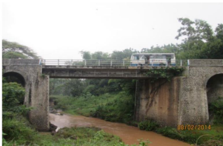
Gambar 3. 8 Sungai Ketegan yang lokasinya melintasi Desa Singasaren