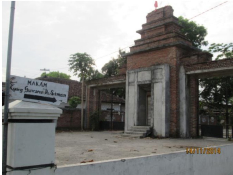
Gambar 3. 3 Makam Warok Gunaseca, asal usul nama desa Siman berasal dari kesaktian warok Gunaseca yang bisa merubah menjadi Sima (Harimau)