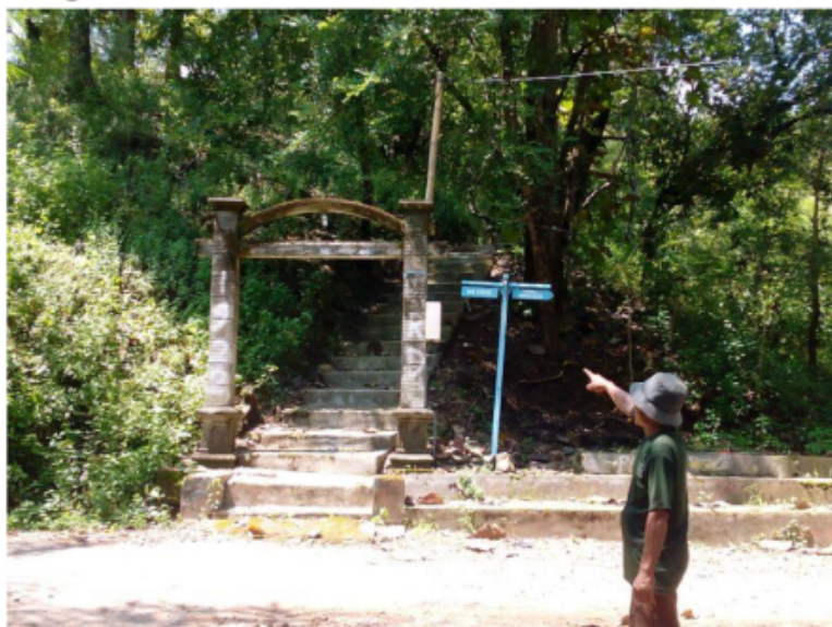
Gambar 3. 9 Petilasan Belik Bacin di Desa Bancangan

Ageng Kutu ketika melawan Raden Batara Katong. Kedua tokoh tersebut bersitegang hingga peperangan pun tidak bisa dihindarkan, adu kesaktian tidak bisa dilepaskan. Peristiwa tersebut akhirnya Raden Batara Katong mampu dipukul mundur hingga Ki Ageng Kutu terbancang-bancang kemudian lokasi pada peristiwa tersebut dinamakan Bancangan.