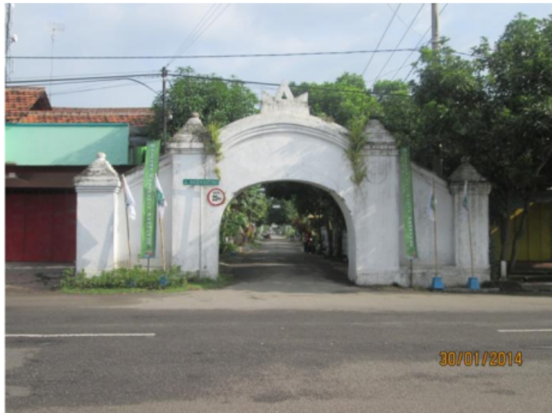
Gambar 3. 7 Plengkung masuk menuju area makam Batara Katong yang terletak di desa Setana