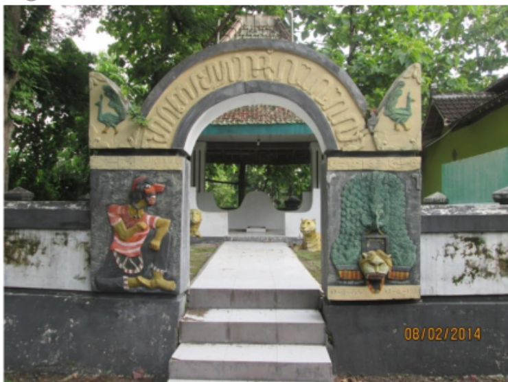
Gambar 3. 4 Makam /Petilasan Warok Singabawa