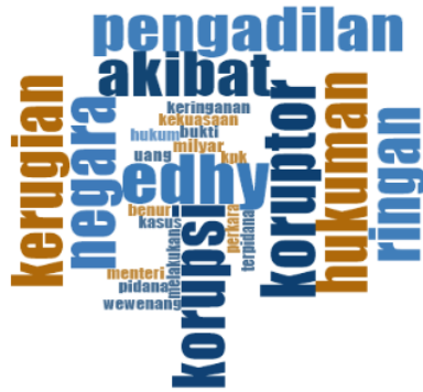
Gambar 1. Hasil olah data melalui aplikasi Nvivo 12 Plus, 2022

Penelitian ini memperoleh data dari analisis mengenai respon tanggapan serta opini masyarakat yang ada di sosial media Twitter dengan menggunakan kata kunci “Edhy Prabowo” dan “Korupsi Menteri” dalam kolom pencarian Twitter. Untuk memudahkan dalam penelitian, pengolahan data menggunakan media aplikasi NVivo 12 Plus dengan hasil data yang disajikan berupa gambar.