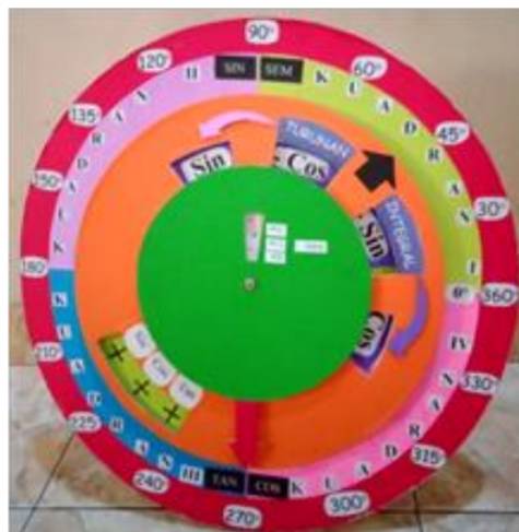
Gambar 2. ROPITRI

Bahan utama, triplek, digunakan dalam pembuatan pembelajaran sepeda pintar ini. Selain itu juga digunakan beberapa alat seperti paku, gunting, lem dan kertas kerbau. Jika semua bahan sudah siap, langkah selanjutnya adalah membuat template agar sesuai dengan salinan yang dibuat. Kemudian potong kertas kerbau agar sesuai dengan kayu lapis yang sudah jadi. Setelah itu, rekatkan kertas ke triplek dengan lem kertas. Jika Anda ingin membuat dan menulis angka, sesuai dengan angka yang diperlukan, cetak dan tulis, potong dan tempel. Setelah semua desain selesai, pasang sekrup di tengah lingkaran. Produk jadi dapat dilihat pada Gambar 2.