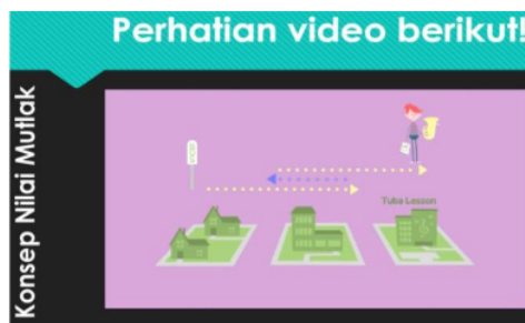
Gambar 2. Media Video Pertama di Power Point

Untuk memahami maksud video yang diputar oleh peneliti, siswa membutuhkan waktu dua kali pertemuan. Media video yang ditampilkan di power point mengadopsi dari tiga sumber youtube channels . Jumlah video ditampilkan sebanyak 3 macam, dan hanya di ambil sebagian penting saja yang bermaksud supaya siswa mampu mendefinisikan sendiri tentang nilai mutlak. Media video yang dimaksud disini berisikan cuplikan dari tiga youtube channels . Dengan demikian, media video ini hanya sebagian kecil dari tampilan di masing-masing ketiga youtube channels . Berikut ketiga media video yang ditanyakan di power point .