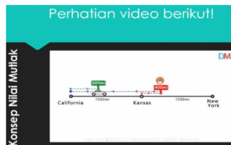
Gambar 3. Media Video Kedua di Power Point