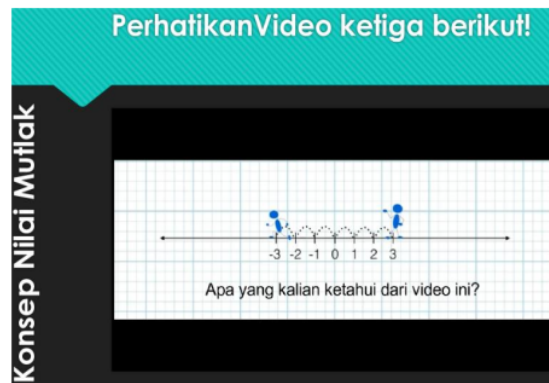
Gambar 4. Media Video Ketiga di Power Point

38 Pada Gambar 3 menunjukkan media video kedua yang berisi sebagian kecil dari cuplikan laman youtube ini https://www.youtube.com/watch?v=zxaT8ArCKjQ . Media video kedua ini dibuat untuk mendukung tayangan media video pertama tadi. Media video kedua ini lebih menunjukkan konsep perjalanan seseorang dengan bantuan pemberian besar perjalanan yang ditempuh. Hal ini dapat diketahui bahwa, media video kedua ini lebih mengarahkan siswa untuk menemukan definisi nilai mutlak sendiri. Setelah melihat tayangan media video kedua ini, siswa mampu menentukan jumlah besaran perjalanan yang ditempuh oleh seseorang. Saat Media video kedua diputar dan diperhatikan oleh semua siswa, peneliti memberikan scaffolding untuk membimbing siswa menemukan definisi nilai mutlak. Setelah melihat media video kedua ini, siswa juga belum mampu menemukan definisi nilai mutlak. Kemudian, siswa akan diberikan media video ketiga dan diharapkan siswa mampu untuk menemukan definisi nilai mutlak. Berikut tampilan media video ketiga yang berada di power point .