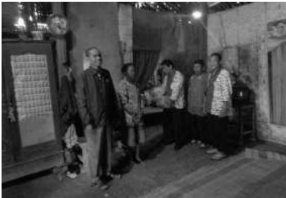
Dokumentasi pembagian bantuan kepada Dhuafa melalui RUMAT (Receh Untuk Umat)