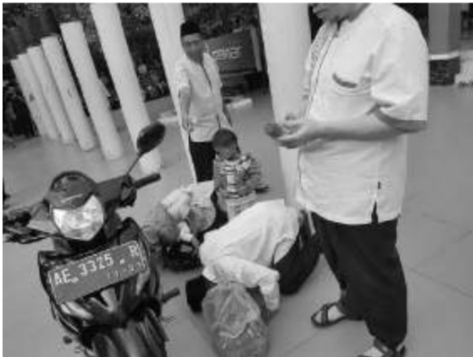
Penyerahan Bantuan Sepeda Motor dari Jamaah Pengajian Ahad Pagi Al Manar untuk Korban Tsunami Palu