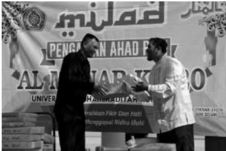
Milad Pengajian Ahad Pagi Al Manar dan Penyerahan Doorize Umrah bagi Jamaah