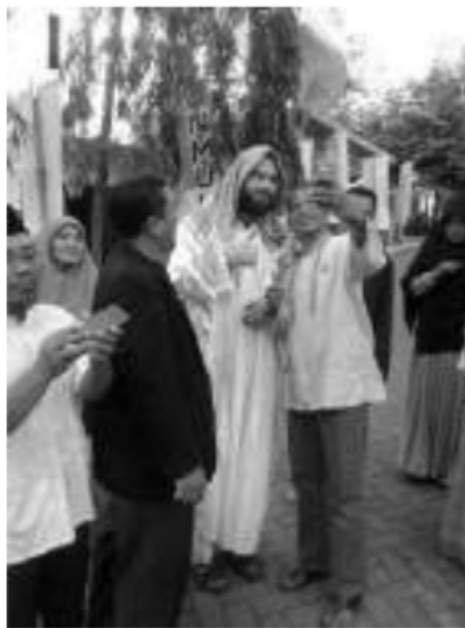
Keakraban Pemateri Syeikh dari Palestina dengan Jamaah seusai memberikan Tausiyah di Pengajian Ahad Pagi Al Manar