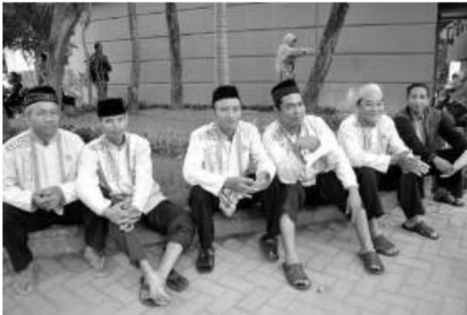
Tim perlengkapan Pengajian Ahad Pagi Al Manar