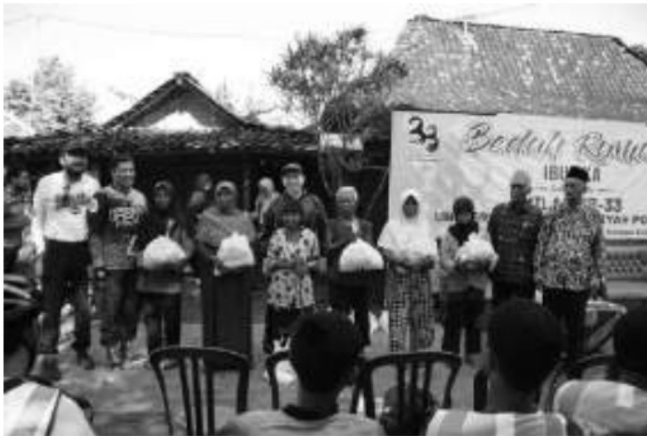
Penyaluran Dana Rumat melalui kegiatan Bedah Rumah dan Gowess dalam rangka Milad UMPo ke 33.