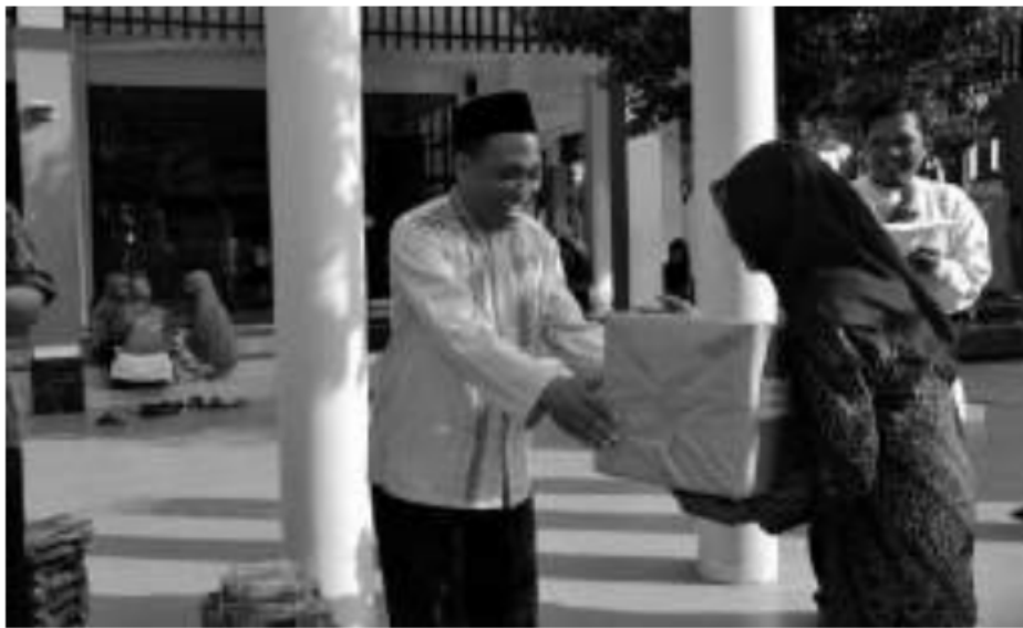
Penyerahan bantuan meja untuk Madrasah Diniyah Muhammadiyah Dalam rangka Milad Pengajian Ahad Pagi Al Manar