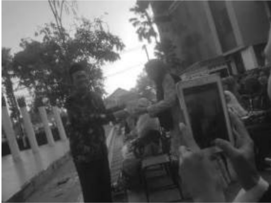
Ceramah Interaktif dan pemberian Doorprize kepada Jamaah yang beruntung.