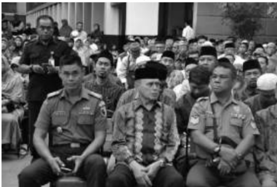
Bersama Tokoh Nasional (Purn) Jendral Kivlan Zein