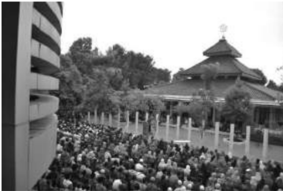
View Pengajian Ahad Pagi Al Manar dengan Drone dan dari Gedung A Lt. 2 Universitas Muhammadiyah Ponorogo