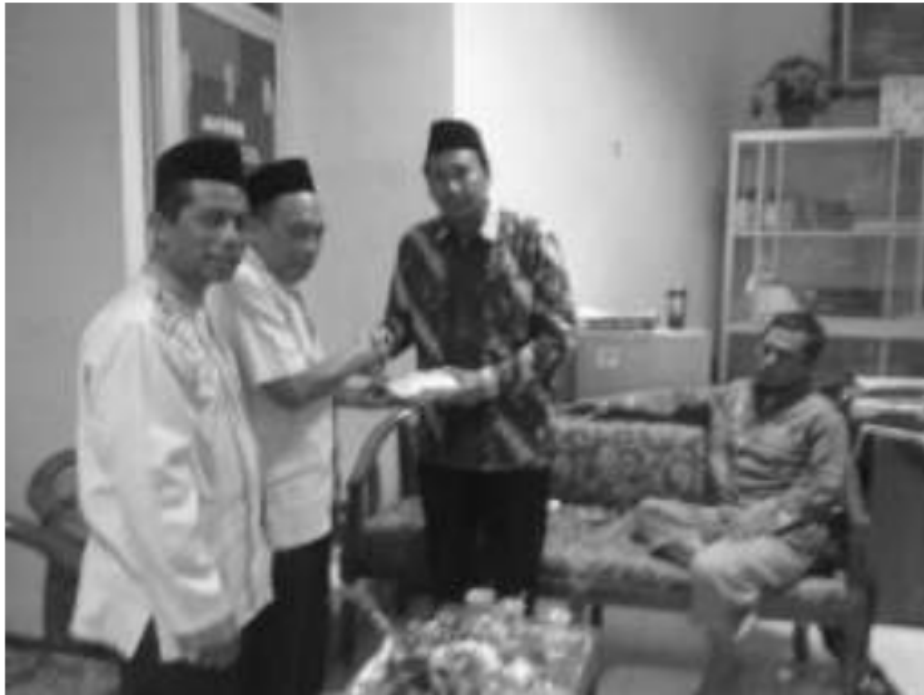
Penyaluran Dana Dakwah Pinggiran daerah 3 T melalui Lembaga Dakwah Khusus Pimpinan Pusat Muhammadiyah