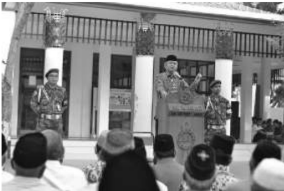
1 Antusias Jamaah mengikuti Pengajian Ahad Pagi Al Manar