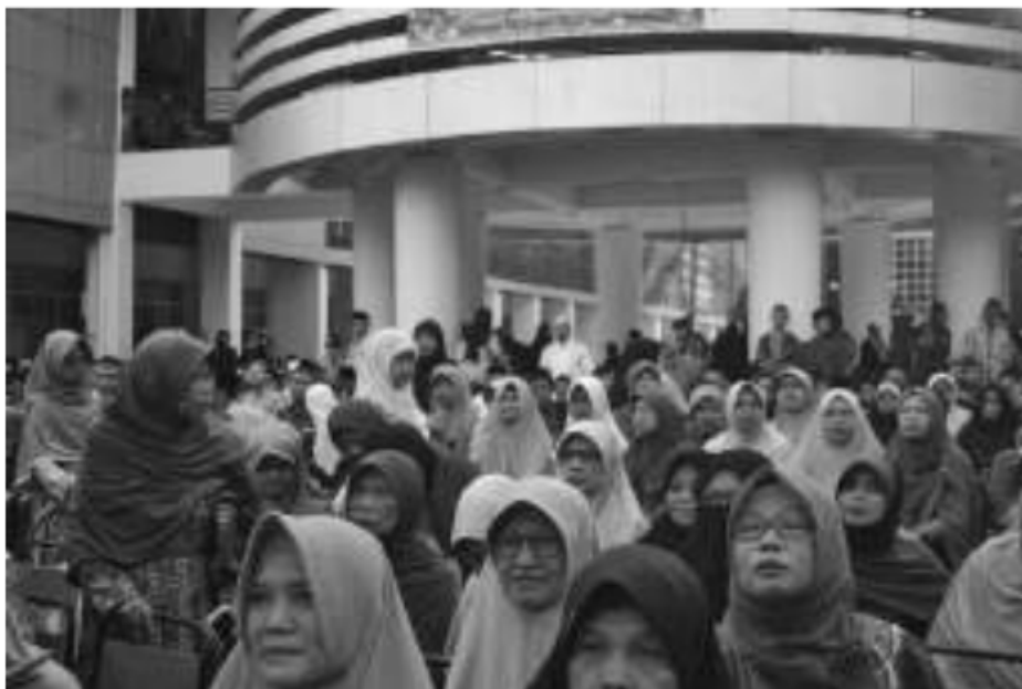
Program Pensyahadatan di Pengajian Ahad Pagi Al Manar dan Dukungan Jamaah Pengajian kepada Muallaf