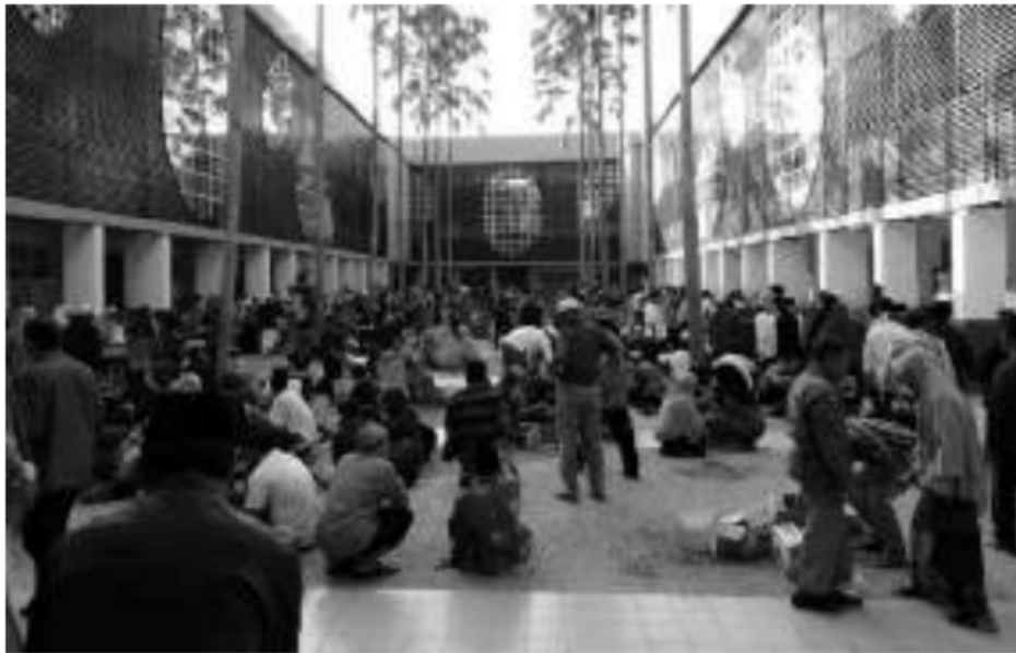
Kebersamaan Jamaah Pengajian dalam kegiatan Sarapan Pecel bersama seusai Pengajian Ahad Pagi Al Manar