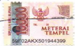
Wa Ode Hono NIM. 19190006