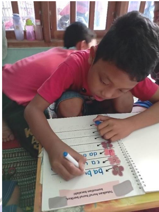
Gambar 6. Foto Anak Membaca Sambil Menulis