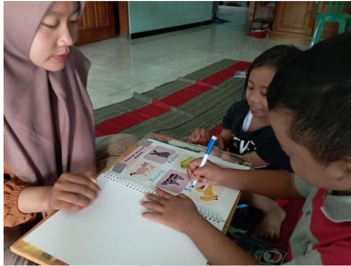
Gambar 8. Foto Anak Menebalkan Huruf