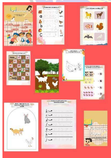
Gambar 1. Desain Sebelum Revisi