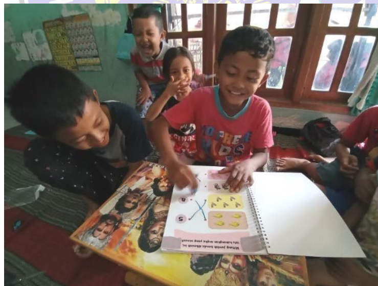
Gambar 7. Foto Anak Berhitung dan Mencocokkan Angka