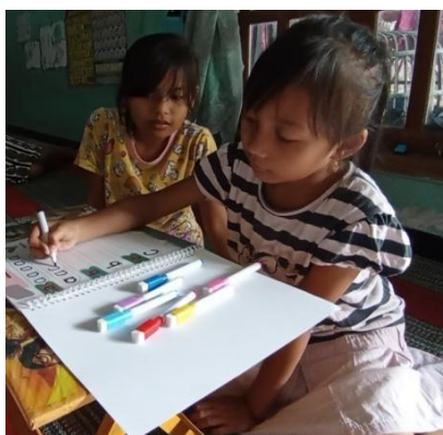
Gambar 5. Foto Anak Menulis Muruf a-c

Berikut dokumentasi berupa gambar saat melakukan uji coba: