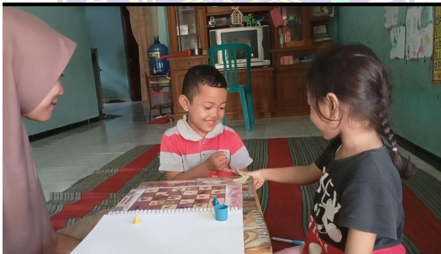
Gambar 11. Foto Anak Bermain Ular Tangga Abjad