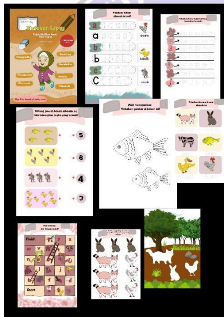
Gambar 3. Desain Sesudah Revisi