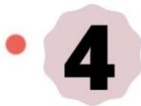
Gambar 4. Angka Empat Sesudah Revisi