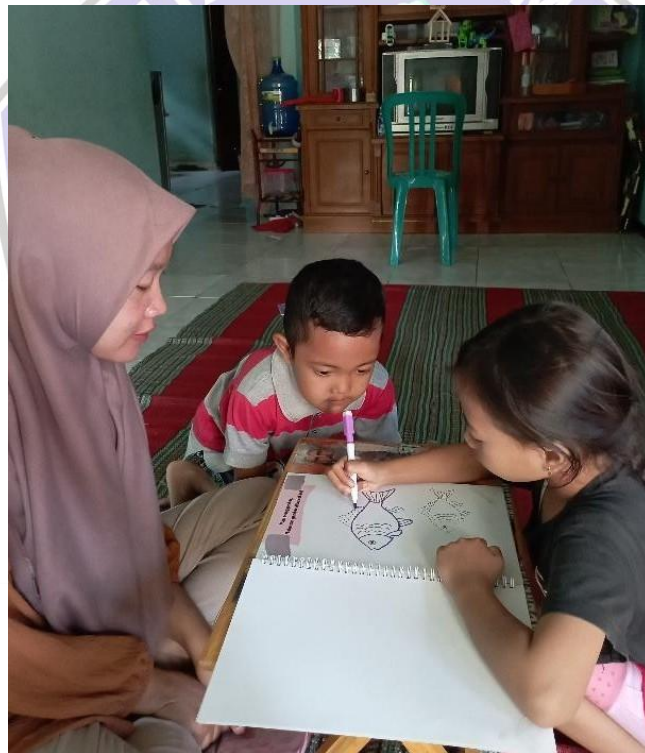
Gambar 9. Foto Anak Menggambar Ikan