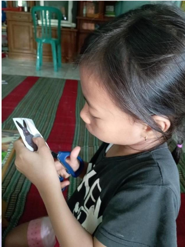
Gambar 10. Foto Anak Menggunting