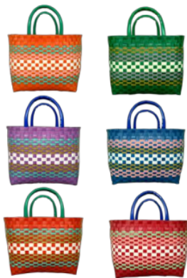
Gambar 2 Tas Rakyat

Target Produksi Perusahaan Tas Rakyat memiliki target produksi sebesar 2500pcs/bulan, karyawan yang dimiliki oleh perusahaan Tas Rakyat sejumlah 22 karyawan, sehingga jika dirata-rata 625 pcs/ minggu. Pihak perusahaan terus melakukan evaluasi terhadap produk tas tersebut agar hasil dari produk tas dan target yang diproduksinya dapat tercapai dan pihak perusahaan selalu berusaha membuat inovasi – inovasi baru terhadap produknya.