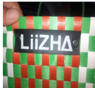
Gambar 3 Branding LiiZHA