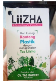
Gambar 4 Price Tag

Penerapan branding dan price tag pada tas membuat tas lebih menarik dan berkelas, meski tas tradisional akan lebih nampak modern. Implementasi bahasa branding ini akan berpengaruh kepada konsumen baik cepat ataupun lambat. Bahasa branding ini diharapkan akan membawa dampak kepada peningkatan penjualan, yang mana bahasa branding atau