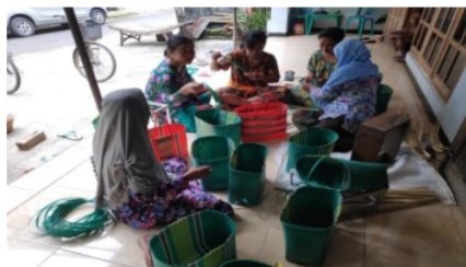
Gambar 4 Pemasang Branding