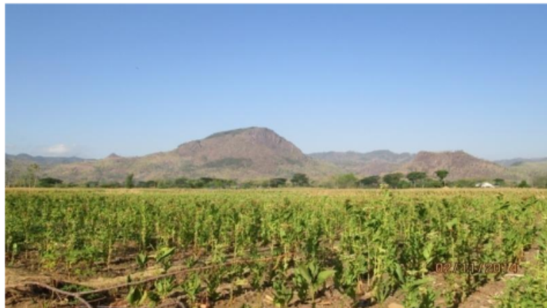
Gunung Pringgitan Nampak dari kejauhan.

Gunung Pringgitan merupakan salah satu objek wisata primadona yang sangat digemari oleh pendaki Gunung, terlebih pada saat bulan purnama tiba sebab Panorama keindahan diatas puncak gunung menjadi lebih eksotis, dibawah cahaya rembulan malam, dan gemerlam bintang, Pendaki bisa melihat Kota Ponorogo, dengan cahaya lampunya yang terus berkedip dari atas Puncak Gunung Pringgitan.