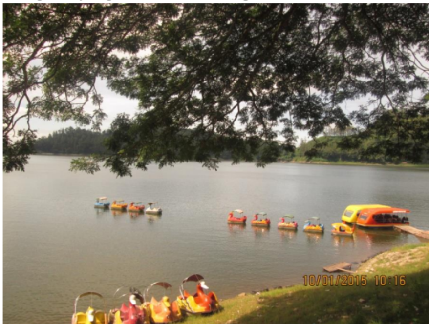
Foto: Telaga Ngebel

Konon salah seorang pendiri Kabupaten ini yakni Batoro Kantong, sebelum melakukan syiar Islam di Kabupaten Ponorogo, Batoro menyucikan diri terlebih dahulu di mata air, yang ada di dekat Telaga Ngebel yang kini dikenal sebagai Kucur Batoro.