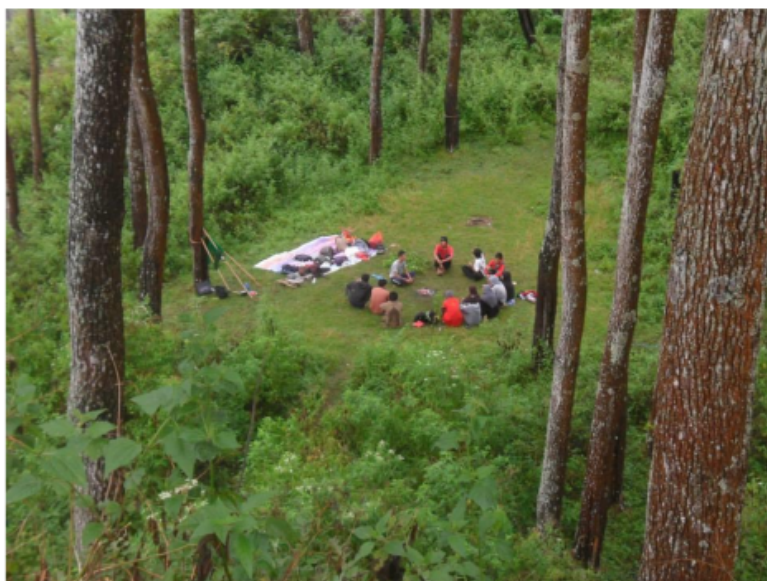
Salah satu lapangan di gunung pringgitan yang biasa digunakan untuk Kemah dan oubond

Akses untuk menuju area wisata ini sangat mudah dijangkau, tepatnya berada di jalur raya Ponorogo-Pacitan, di Desa Caluk, Kecamatan Slahung, sebagai arah petunjuk untuk memudahkan pengunjung dari luar daerah, sebelum menuju ke Gunung Pringgitan biasanya pengunjung akan berhenti di Jalan Masuk Gunung Pringgitan yang ditandai dengan sebuah Tugu bersejarah di Pemakaman umum Watu Dakon, yaitu tugu TGP (tentara Geni Pelajar) sebuah tugu untuk mengenang peristiwa pada masa Belanda, di tugu tersebut dahulu banyak serdadu Belanda yang tewas oleh pejuang-pejuang pelajar kita.