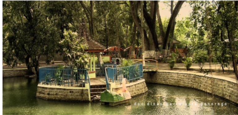
Taman di Tengah Danau Mini

Taman Ngembag sangat asri karena disekeliling sumber mata air terdapat banyak pohon besar sehingga membuat suasana menjadi teduh. Pada tahun 2003 pemerintah Ponorogo kemudian mengembangkan Taman Ngembag menjadi salah satu obyek wisata keluarga.