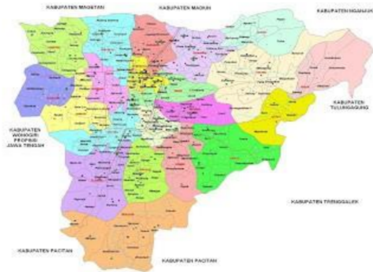
Peta Wilayah Administrasi Kabupaten Ponorogo