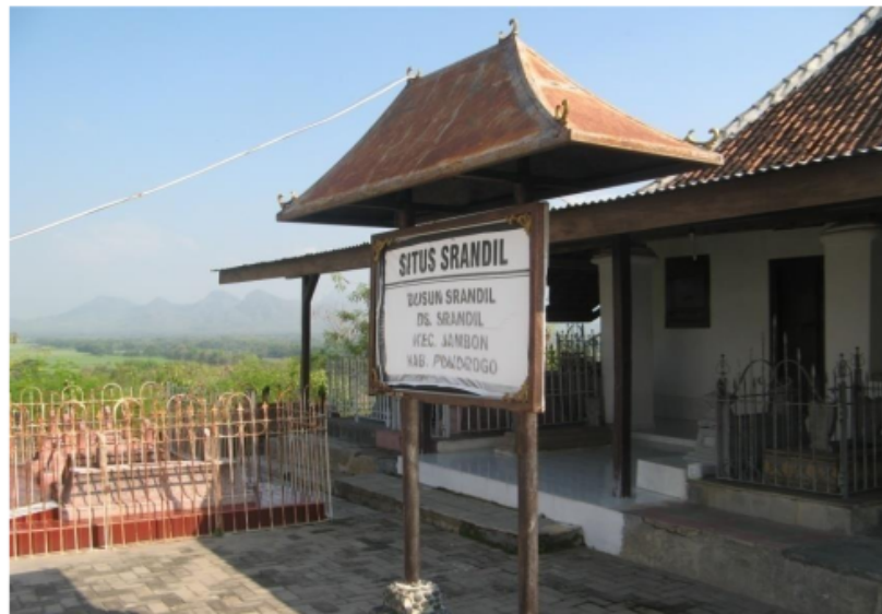
Makam srandil Nampak dari sebelah samping

Jika dibandingkan dengan makam-makam Islam yang ada di Nusantara, Pasarean Srandil termasuk pemakaman yang relatif muda usianya, yaitu dibangun pada abad ke-19. Namun ciri khas sebagai “makam Islam Nusantara” masih tetap melekat, seperti adanya pengaruh budaya asli bangsa Indonesia budaya Hindhu maupun budaya lokal (Jawa).