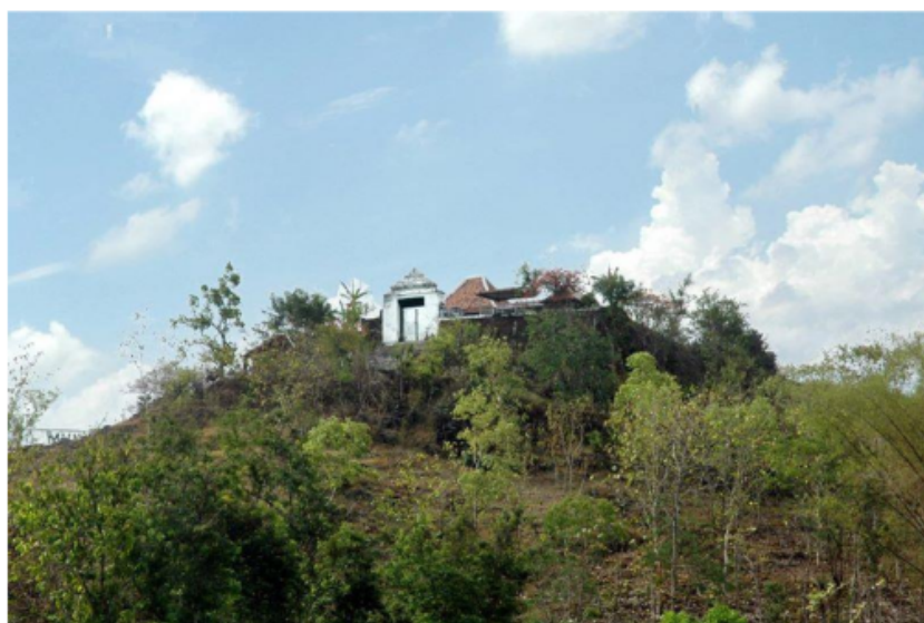
Pesarean Srandil Nampak dari Bawah

Ditinjau dari segi geografis, Pasarean Srandil terletak di areal perbukitan yang saling sambung menyambung yang semuanya berjumlah lima bukit. Jika diurutkan mulai dari barat ke timur, kelima bukit tersebut adalah Bukit Lemu, Bukit Bancak, Bukit Ngrayu, Bukit Srayu, dan Bukit Srandil.