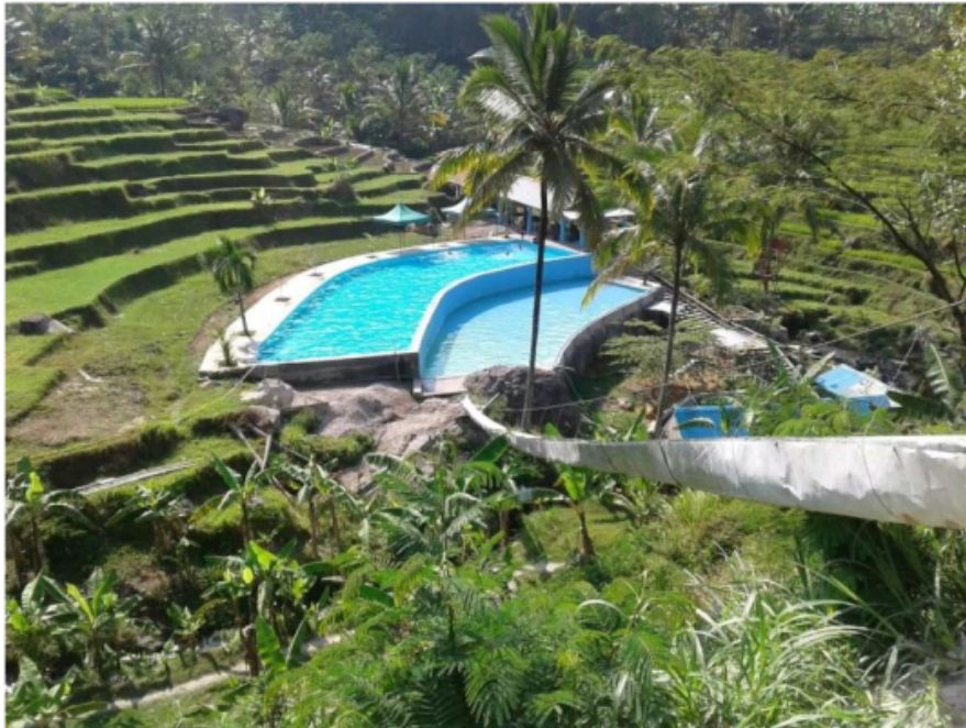
Foto: Pemandian Air Hangat Tirta Husada Ngebel

Sumber panas desa wagir lor ini hanya berjarak kira-kira 1 km dan bisa ditempuh selama 10-15 menit dari telaga ngebel. Akses jalan menuju ke tempat ini cukup memadai dilengkapi dengan keindahan panorama alam khas pegunungan yang membentang persawahan luas, perkebunan indah membuat suasana menjadi lebih menakjubkan. Sumber air panas ini masih sangat asri.khas suasana dan situasi yang sejuk menyegarkan badan, pikiran dan kepuasan hati.