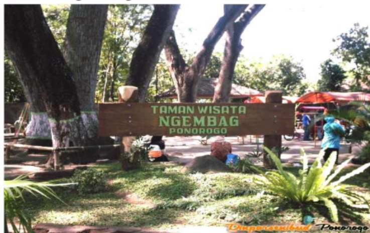
Taman Ngembag dari depan gerbang pintu masuk

Taman Wisata Ngembag adalah taman wisata yang terletak di Kelurahan Ronowijayan Kecamatan Siman sekitar 3 km di sebelah timur dari pusat kota Ponorogo. Taman ini mirip dengan telaga mini, terdapat sumber mata air alami yang mengambang (merendam permukaan tanah), kemudian tempat ini dinamakan Ngembag.