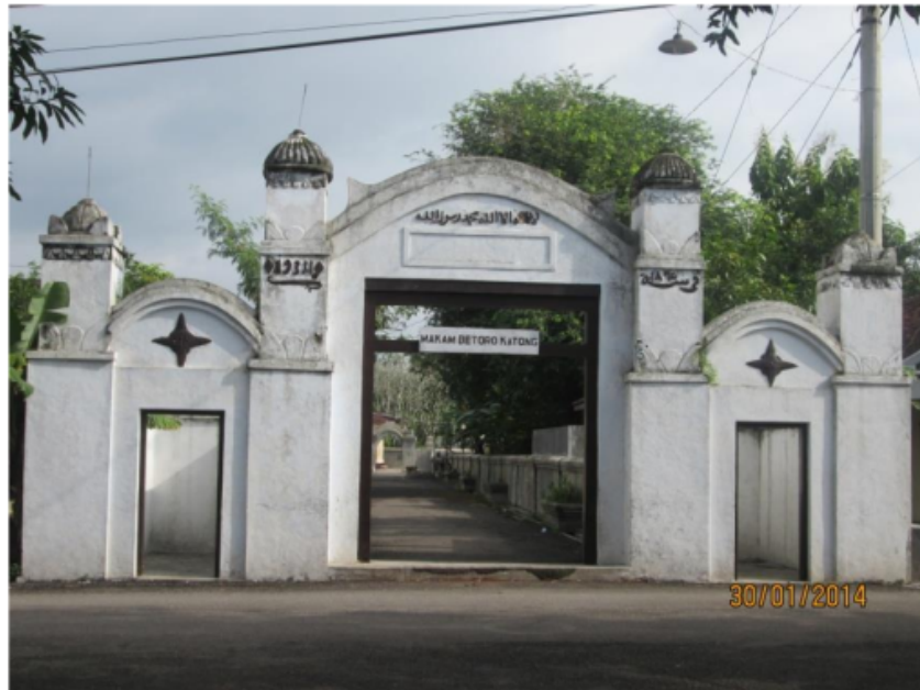
Gerbang Makam Batara Katong

Makam Raden Batoro Katong biasanya ramai dikunjungi setiap hari jumat dan sabtu, berbagai peziarah datang dari berbagai kota dan daerah turut mendoakan, mengambil ibrah serta keteladan beliau semasa hidup yang berjasa telah menyebarkan agama Islam di pulau Jawa, khususnya masyarakat Ponorogo. Selain makam Raden Batoro Katong di koplek pemakaman setono juga terdapat makam tokoh-tokoh lainnya seperti Patih Seloadji, Ki Ageng Mirah serta Istri-istri Raden Batara Katong.