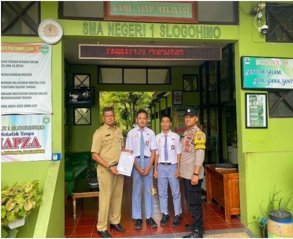
Gambar 1 : Pemberian Maklumat Kepada Wakasek Kesiswaan SMA N 1 Slogohimo