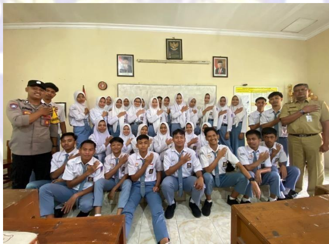
Gambar 3 ; Foto Bersama Dengan Kelas XI 1