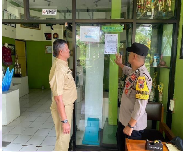
Gambar 2 : Penempelan Maklumat Di SMA N 1 Slogohimo