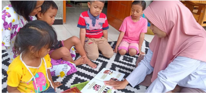
Gambar 2.4 Uji efektivitas anak usia 4-5 tahun