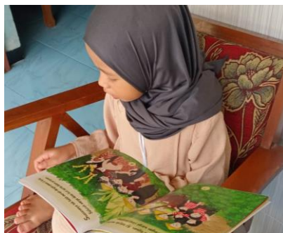
Gambar 2.3 Uji efektivitas anak usia 6 tahun

Sedangkan anak dengan usia 4-5 tahun belum bisa menjelaskan tradisi Methik Padi maupun pekerjaan seorang jurnalis. Namun mereka mampu mengingat dan menunjuk gambar-gambar tertentu yang mereka suka dalam buku. Semua anak menunjukkan ketertarikan yang sama yaitu pada gambar prosesi Methik Padi. Setelah membaca, anak diminta menyampaikan pendapat terhadap buku. Semua anak menyatakan suka dengan buku “Jurnalis Cilik Methik Padi”.