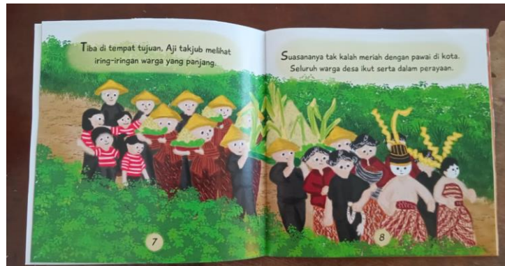
Gambar 2.2 Isi buku “Jurnalil Cilik Methik Padi”