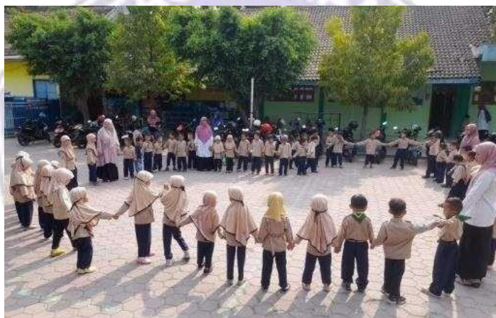
Gambar 2: Transfer Pengetahuan dengan Bermain

Bagi anak-anak usia dini transfer pengetahuan tentunya diterapkan sesuai dengan sistem yang sesuai dengan tingkatannya terutama sesuai dengan kondisi psikologisnya. Ilmu pengetahuan yang diperoleh anak dari guru inilah yang akan sangat mempengaruhi bagi kepribadiannya dalam hidup sehari-hari selanjutnya. Sangatlah tepat transfer of knowledge yang diterapkan TK Aisyiyah Somoroto dilakukan melalui perencanaan yang matang dengan menyusun modul ajar guna mengoptimalkan peran guru dalam pembelajaran. Aktualisasi pembelajaran dimaksudkan untuk memasukkan aspek nilai-nilai ilmiah kepada siswa agar dapatnya semaksimal mungkin siswa dapat menguasainya. Guna menghindarkan siswa mengalami kejenuhan dalam belajar bagi siswa juga diupayakan adanya variasi metode pembelajaran bagi siswa, antara lain dengan menyanyi, tadabur alam, bermaindan sebagainya. Menyanyi dan bermain itu, dalam dunia anak tidak boleh hilang, sehingga anak usia dini dapat belajar dalam suasana yang menyenangkan.