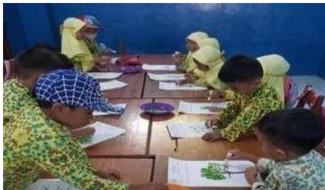
Gambar 3: Pengembangan Bakat Siswa

Sebagai fasilitator, guru memiliki tugas untuk memfasilitasi proses pembelajaran yang efektif dan efisien. Guru harus mampu memahami kebutuhan dan kecepatan belajar siswa serta menyediakan fasilitas yang dibutuhkan. Guru juga harus mampu menciptakan lingkungan yang kondusif untuk belajar dan berdiskusi antar siswa. Selain memberikan dan menyediakan pelayanan terkait fasilitas belajar guru sebagai fasilitator juga harus memberikan arah yang baik serta memberikan semangat (Munawir, 2022). Variasi sumber belajar yang diterapkan guru merupakan usaha nyata yang ditujukan agar para siswa mampu mencapai tujuan yang dimaksudkan dalam pembelajaran.