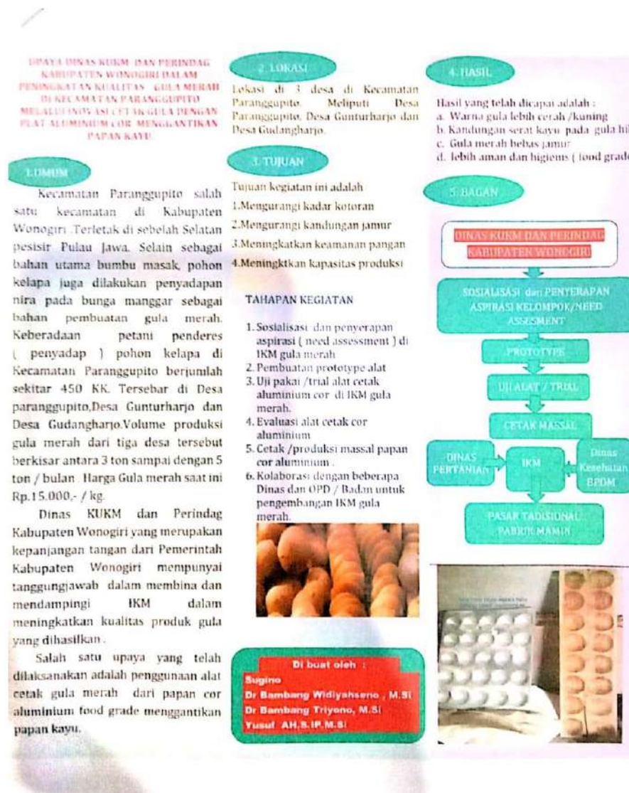
Gambar 1. Model Poster HKI

tertentu, termasuk beberapa keju. Biasanya jamur terlihat oleh mata manusia saat tumbuh pada makanan, dan dapat dan mampu mengubah tampilan makanan. Makanan dapat menjadi lunak dan berubah warna, rasa, aroma dan lainnya. Ribuan jenis jamur berbeda ada dan ditemukan hampir di mana-mana di lingkungan. Bisa dibayangkan jamur adalah cara alam untuk mendaur ulang. Selain terdapat pada makanan, juga dapat ditemukan di dalam ruangan dalam kondisi lembab.