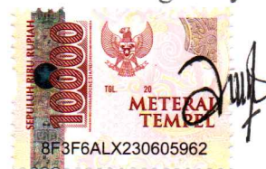
Diyah Ayu Nur Anggraini