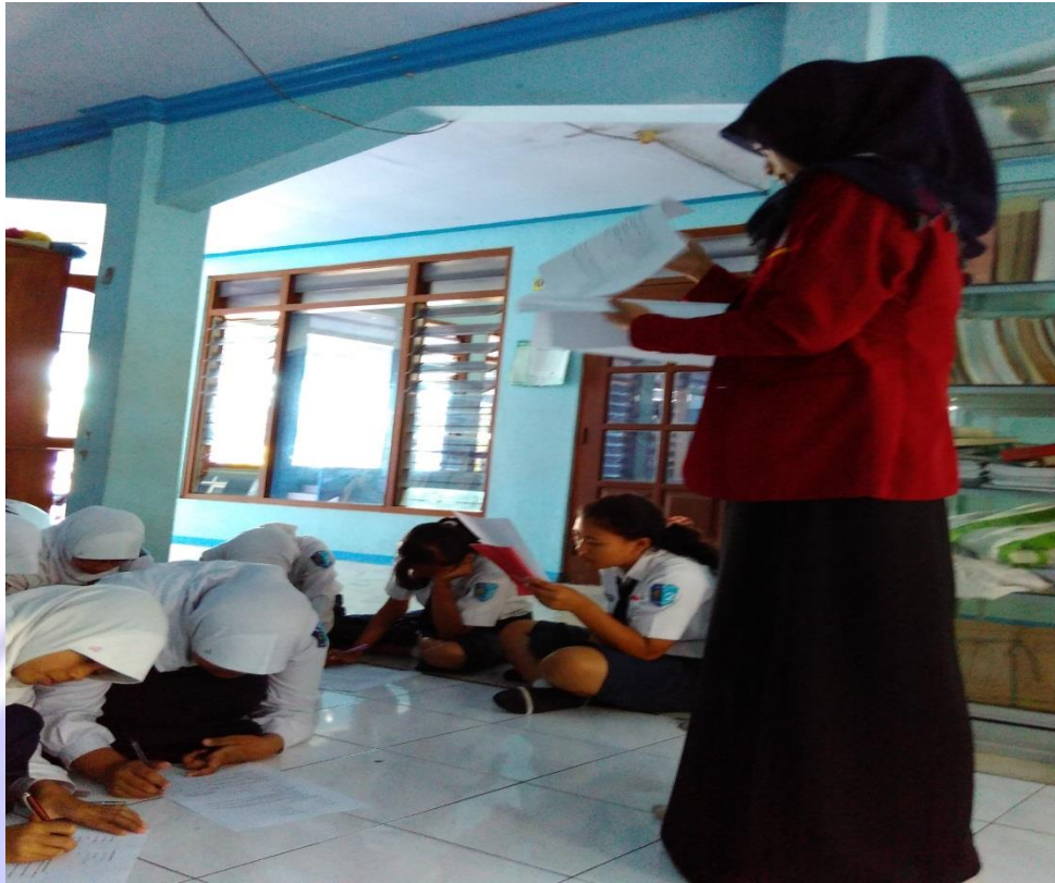
FOTO KEGIATAN DI SEKOLAH