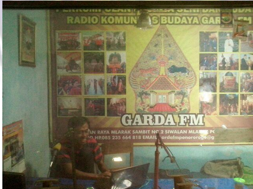
Ruang Siaran Radio Gelora Muda (Garda) FM