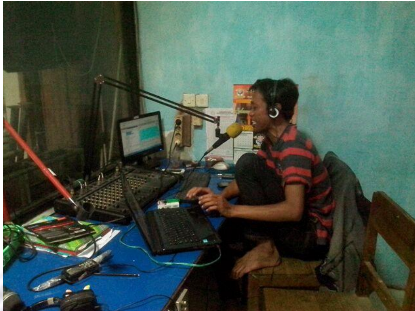
Penyiar Radio Gelora Muda (Garda) FM (dodo)