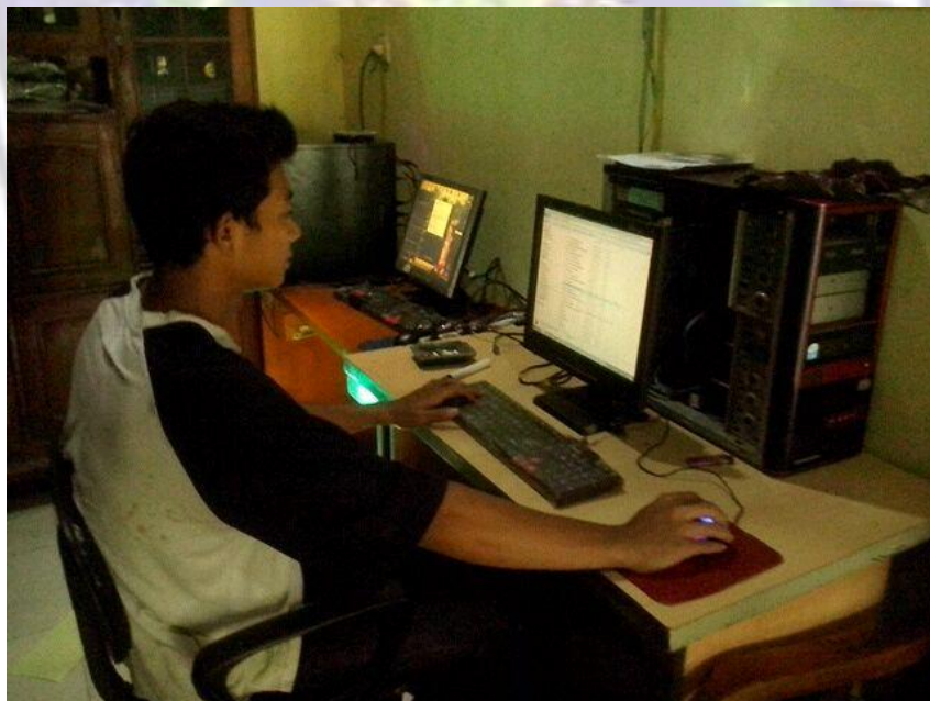
Tempat Produksi Radio Gelora Muda (Garda) FM