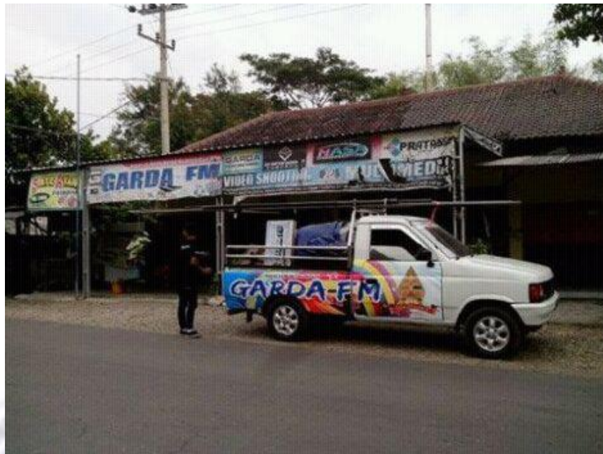
Radio Gelora Muda (Garda) FM Tampak Dari Jalan Raya