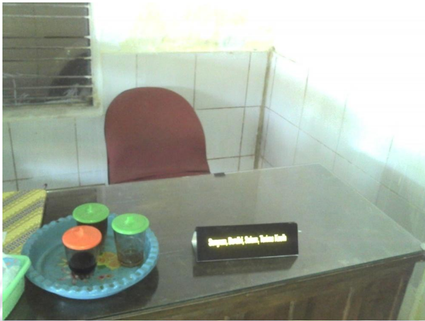
Tempat Administrasi Radio Gelora Muda (Garda) FM