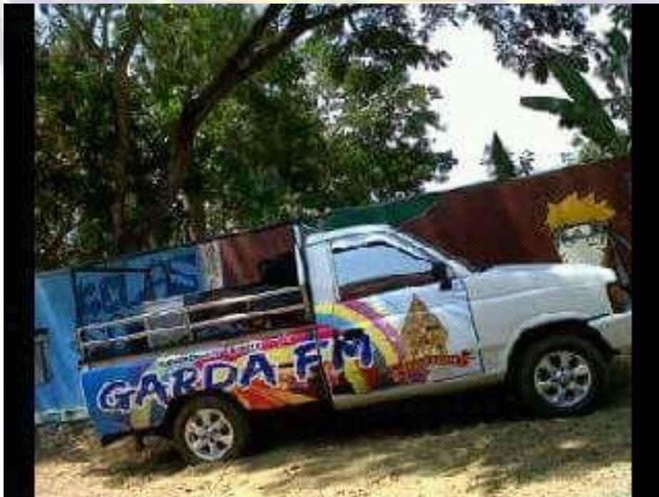
Kendaraan Operasioanal Radio Gelora Muda (Garda) FM