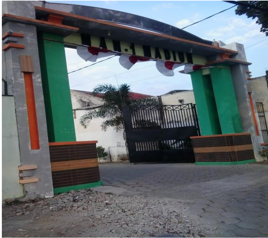
Gambar 1. MAN 1 Madiun tampak dari muka