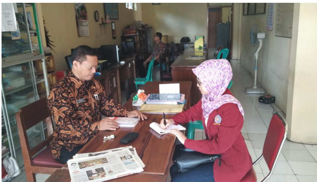
Wawancara dengan Lurah Jingglong