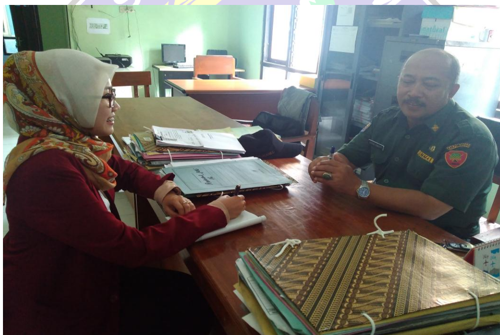
Wawancara dengan Camat Ponorogo