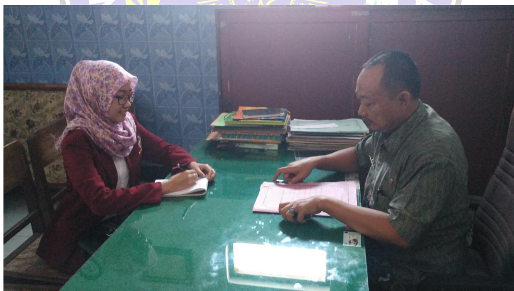
Wawancara dengan Lurah Keniten