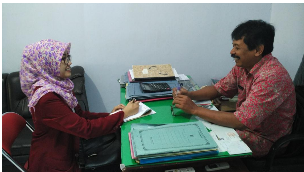
Wawancara dengan Lurah Mangkujayan