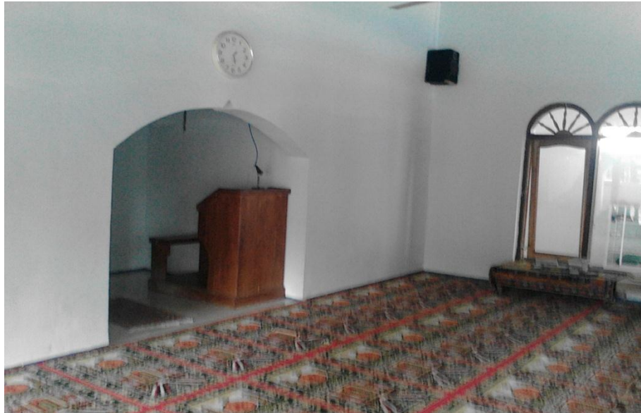
Gambar 5: Tempat Pendidikan Al-Qur'an