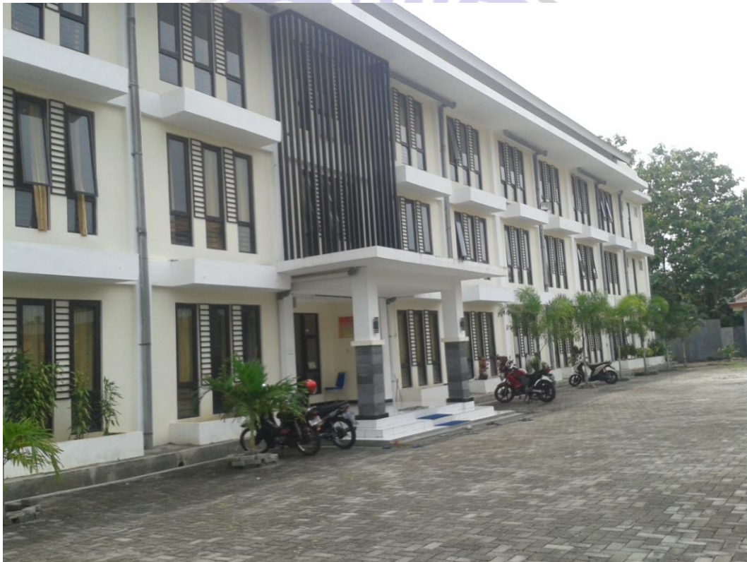
Gambar 1. Foto Pondok

Kode : 04/Do/23-6/2016 Tanggal : 19 Juli 2016, Pukul 10.00-10.30 WIB Disusun jam : 19 Juli 2016, Pukul 20.00-21.00 WIB Topik dokumentasi : Foto-foto