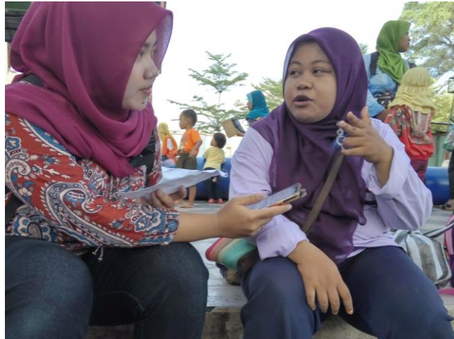
Ibu Ayu pengunjung pagi Madiun Umbul Square