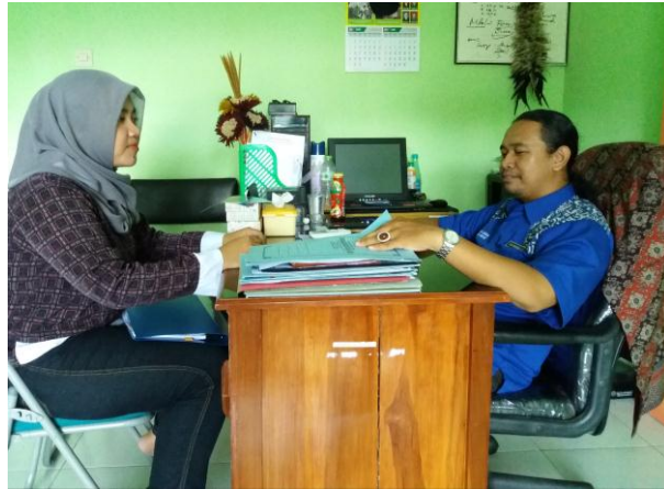
Kepala Divisi Umum dan Pemasaran Madiun Umbul Square