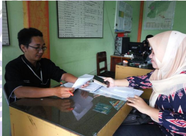
Kepala Sub Divisi Pemasaran Madiun Umbul Square