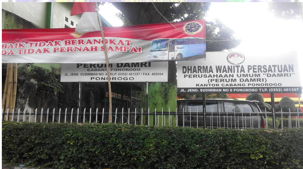
Lokasi penelitian yaitu di Perum Damri Ponorogo.