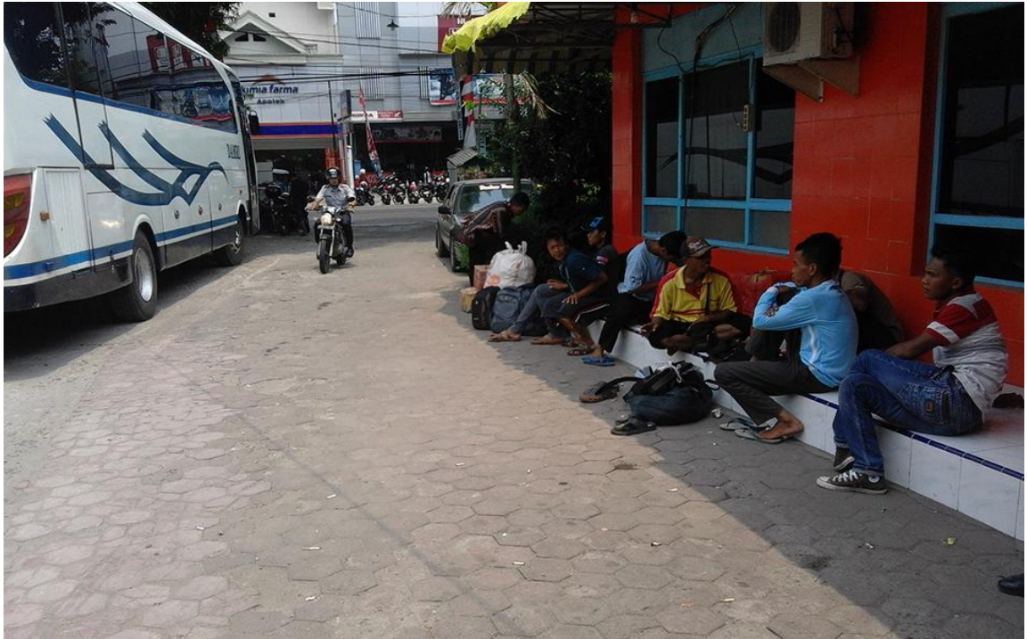
Calon penumpang angkutan umum yang sedang menunggu jadwal keberangkatan bus.