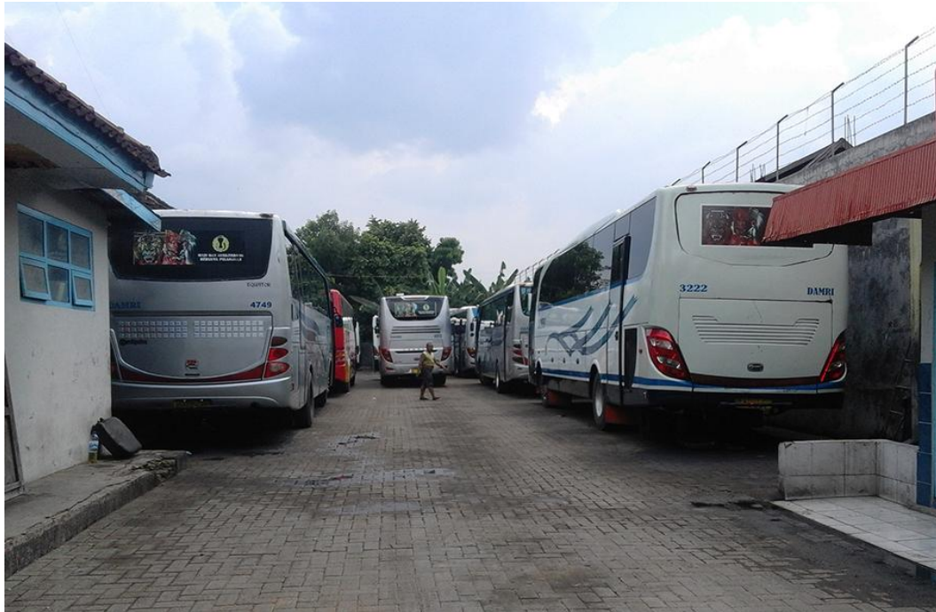
Kondisi Garasi Bus milik Perum Damri Ponorogo.