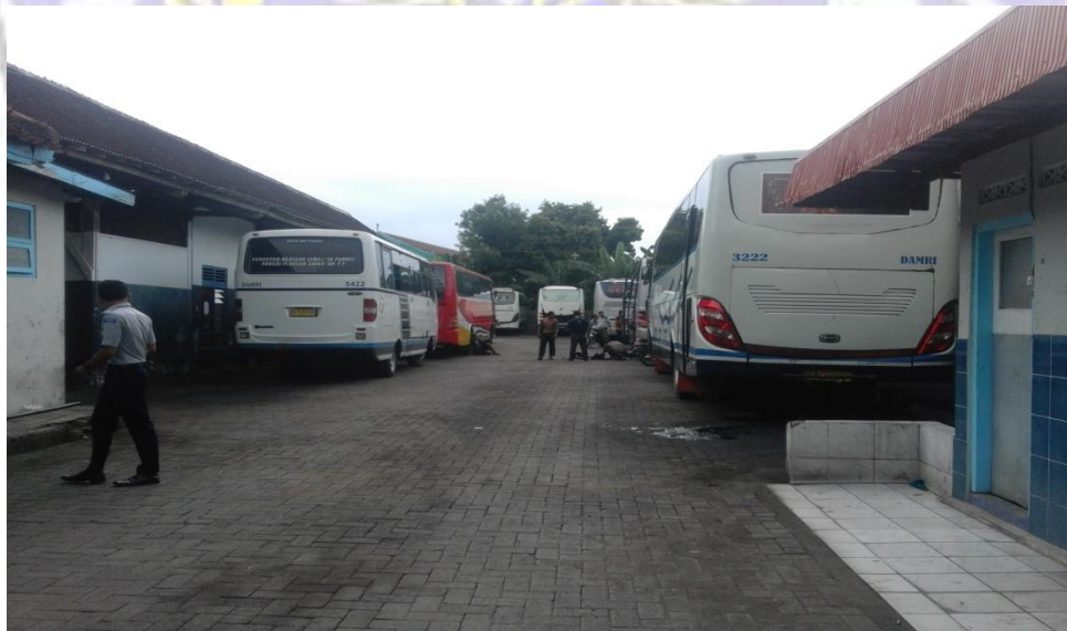
Kondisi Garasi Bus milik Perum Damri Ponorogo.