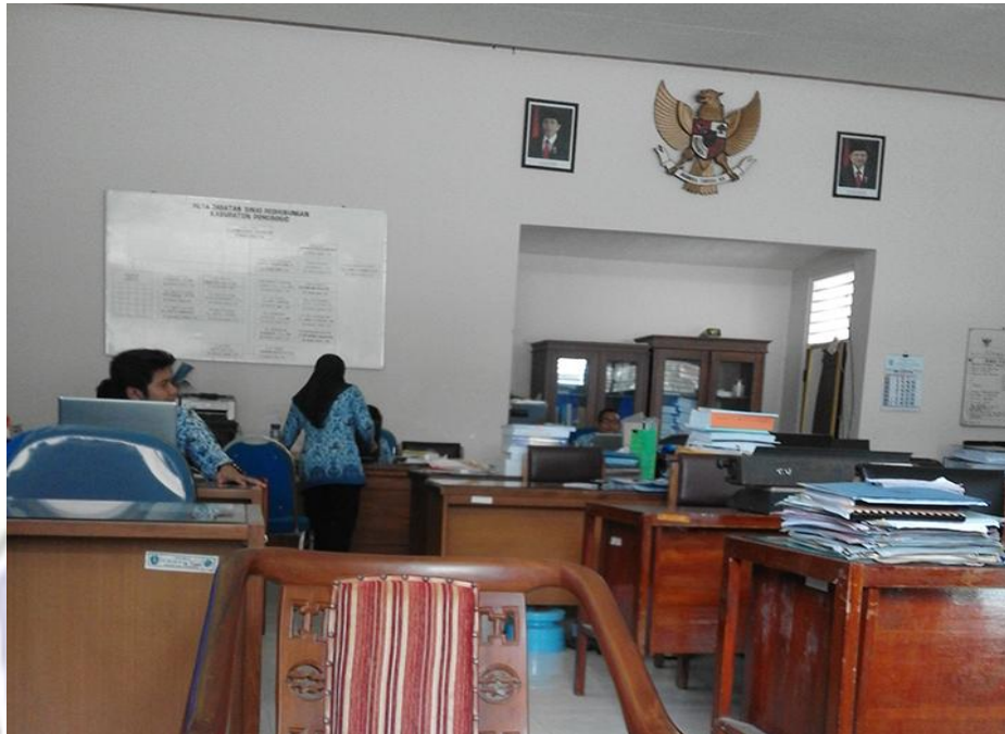
Kondisi ruang kerja kantor Dinas Perhubungan Ponorogo.