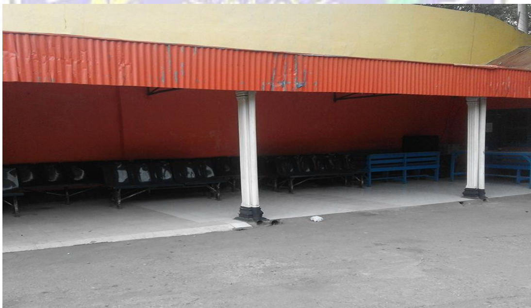
Kondisi ruang tunggu (Halte) penumpang Perum Damri Ponorogo.