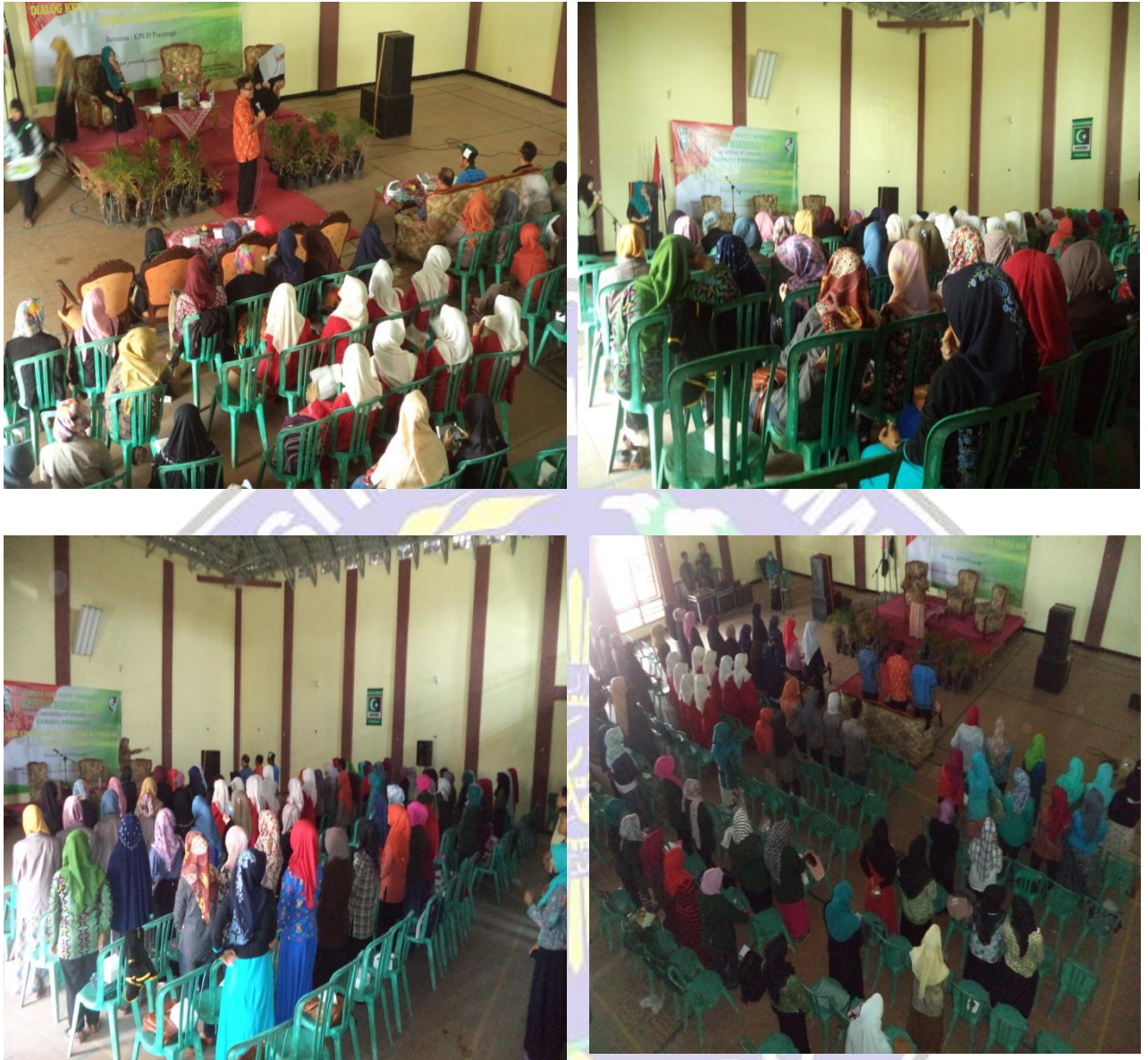
Gambar 1.1 Kegiatan Dialog Politik Mahasiswa HMI bersama KPU Kabupaten Ponorogo