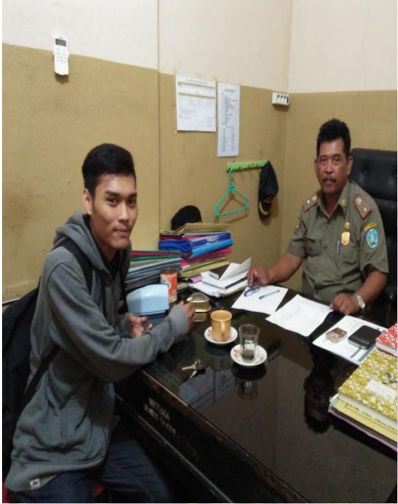
Wawancara dengan ka ops ketertiban