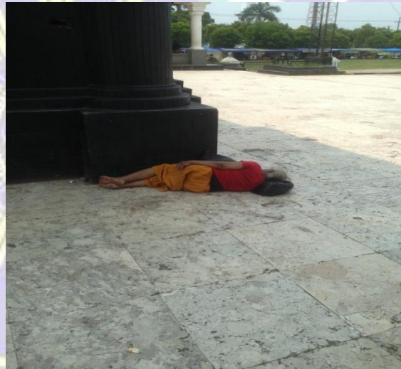
Gepeng Tidur di panggung utama Aloon-aloon