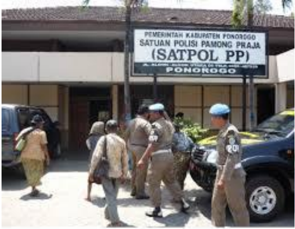
Kantor SATPOL PP