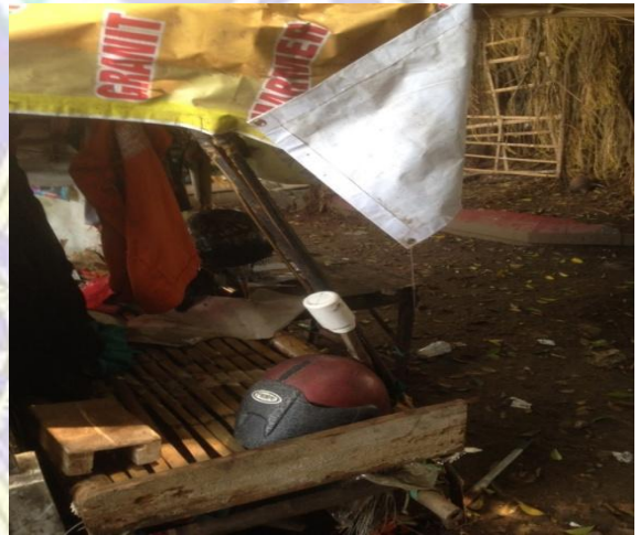
Tempat tinggal gelandangan di Aloon-aloon