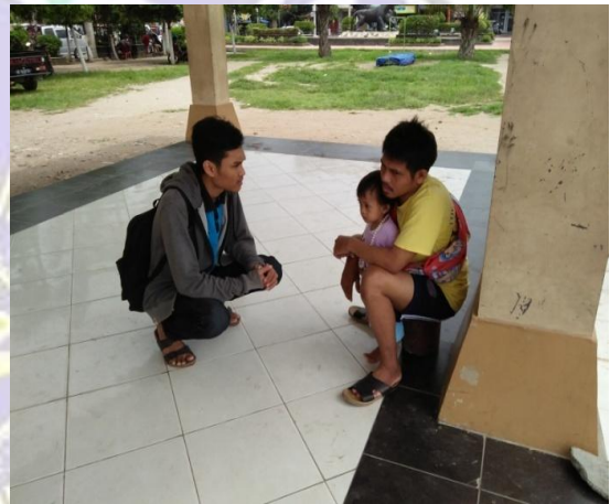
Wawancara dengan masyarakat pengunjung Aloon-aloon