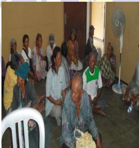
Pengemis yang tertangkap dikantor satpol