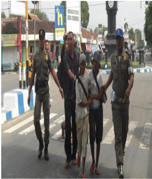
Penertiban penangkapan di Aloon-aloon