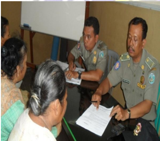
Pendataan gepeng oleh Satpol PP