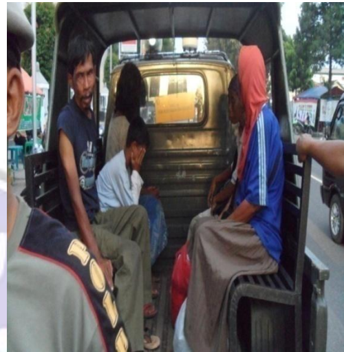
Penertiban di Aloon-aloon