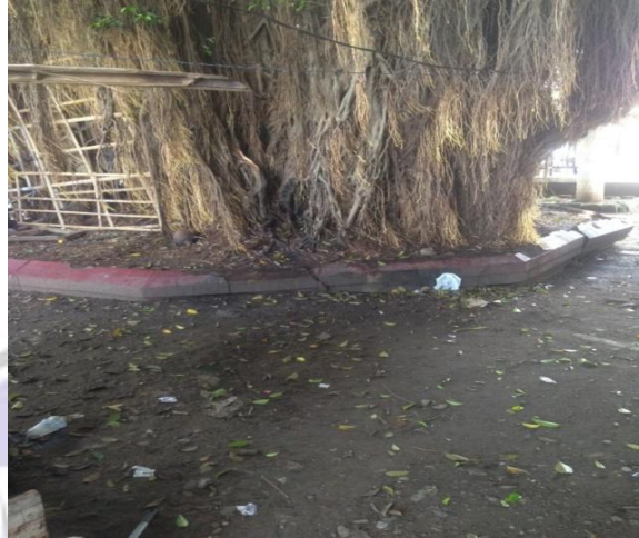
Pohon di jadikan tempat berak dan kencing gepeng