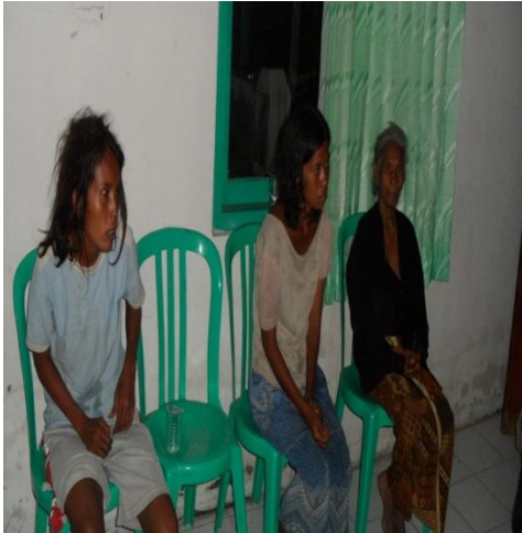
Gelandangan yang tertangkap