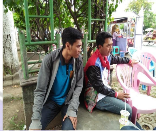
Wawancara dengan masyarakat pengunjung Aloon-aloon