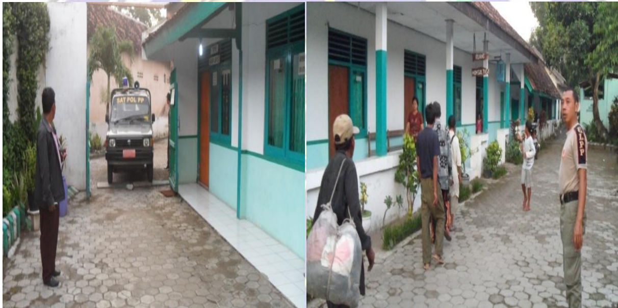
Gelandangan dan Pengemis di serahkan ke Dinas Sosial