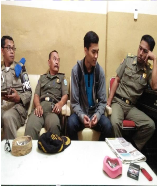
Wawancara dengan beberapa anggota Satpol PP