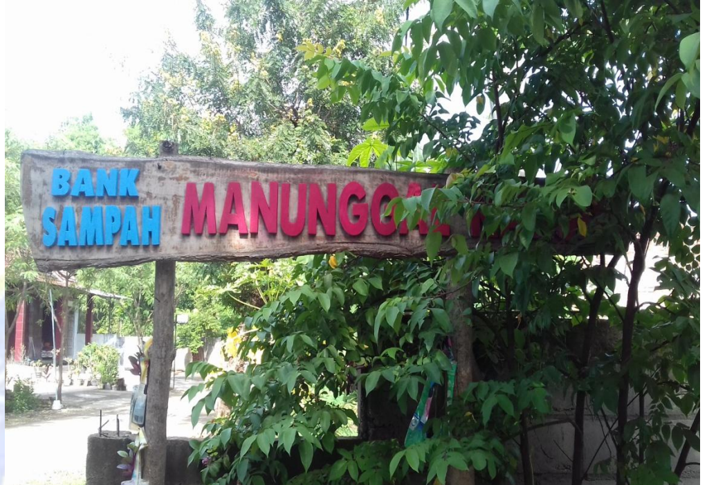
2. Kegiatan Rutin Bank Sampah menimbang bahan bekas dan membuat kreasi