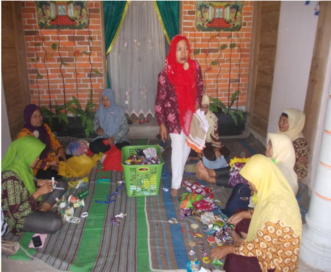
7. salah satu produk olahan sampah dari Bank Sampah Manunggal Karso