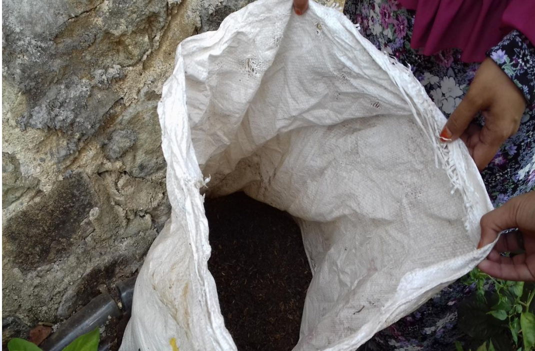
13. Ini tanaman yang menggunakan pupuk kompos sebagai upaya pelestarian lingkungan hidup