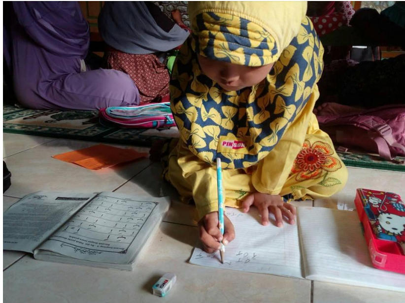
Gambar 2. Foto Kegiatan Para Santri