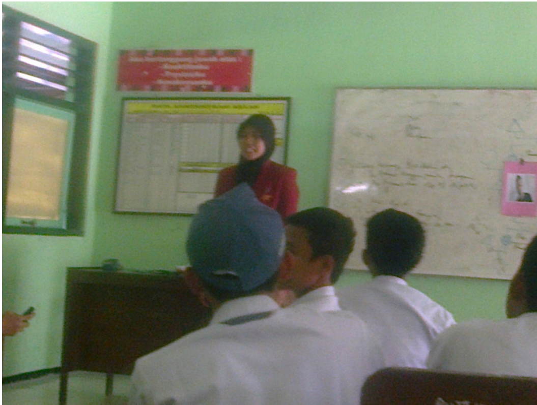
The Picture When Teaching and Learning Process