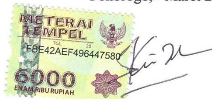
Imam Ghozali NIM. 11440324