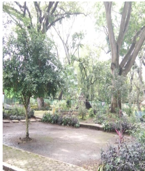
Swasana yang asri Di Obyek Wisata Ngembag