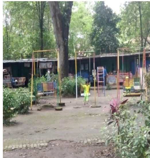
Kondisi tempat bermain yang ada di Obyek Wisata Ngembag