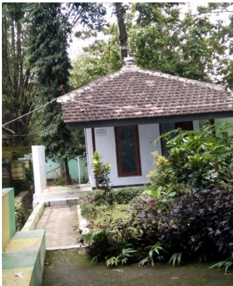
Kondisi musholla yang ada di Obyek Wisata Ngembag