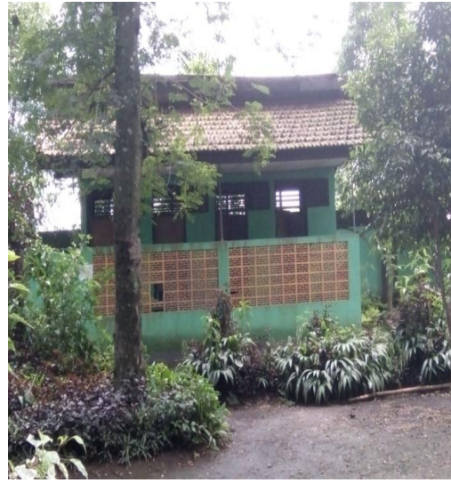
Kondisi toilet yang ada di Obyek Wisata Ngembag