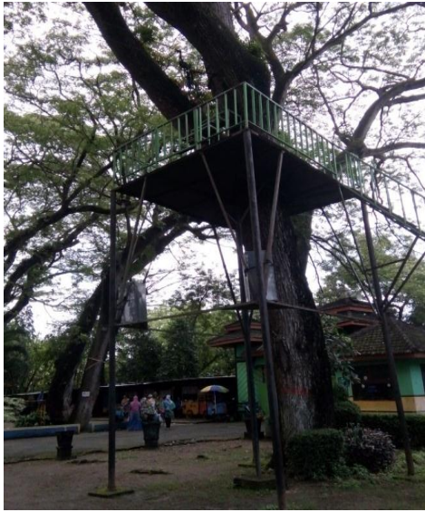
Kondisi permainan Flying fox di Obyek Wisata Ngembag