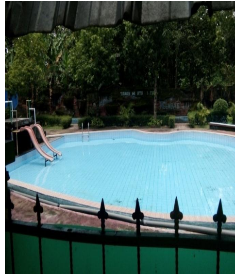
Kondisi kolam renang anak yang ada di Obyek Wisata Ngembag