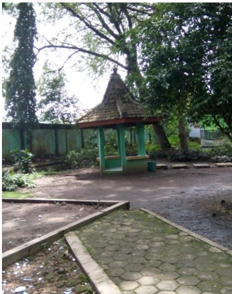
Kondisi Gazebo yang ada di Obyek Wisata Ngembag