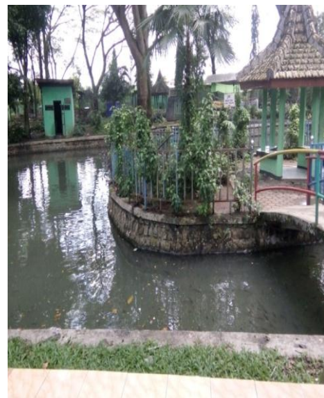
kondisi kolam ikan yang ada di Obyek Wisata Ngembag