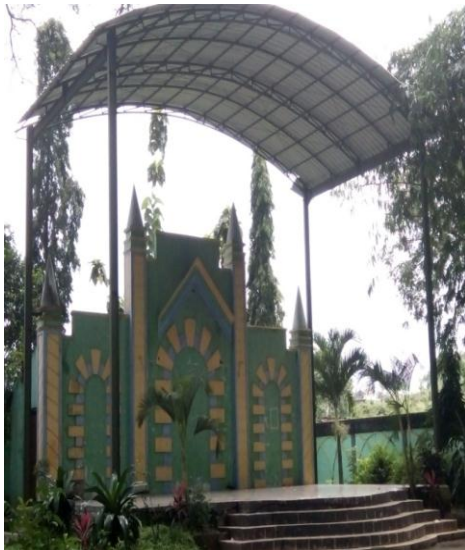
Kondisi panggung yang ada di Obyek Wisata Ngembag