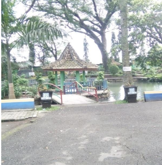
Gazebo yang berada pada tengah kolam ikan