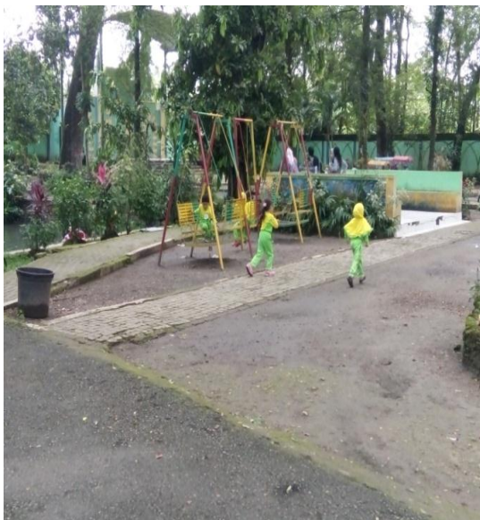
Kegiatan wisatawan yang ada di Obyek Wisata Ngembag