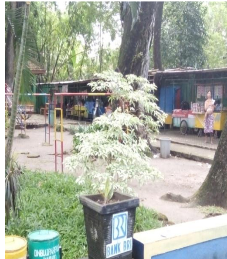
Para pedagang yang berada di Obyek Wisata Ngembag