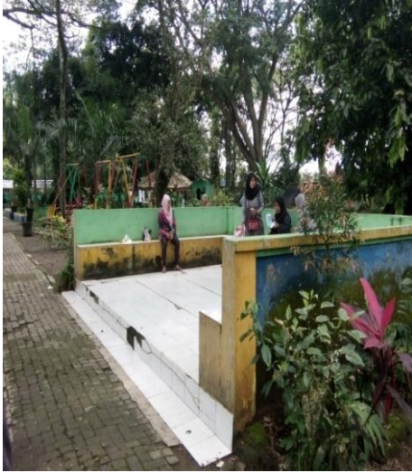
kegiatan orang dewasa yang ada di Obyek Wisata Ngembag