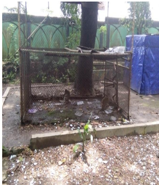
Kondisi kandang monyet