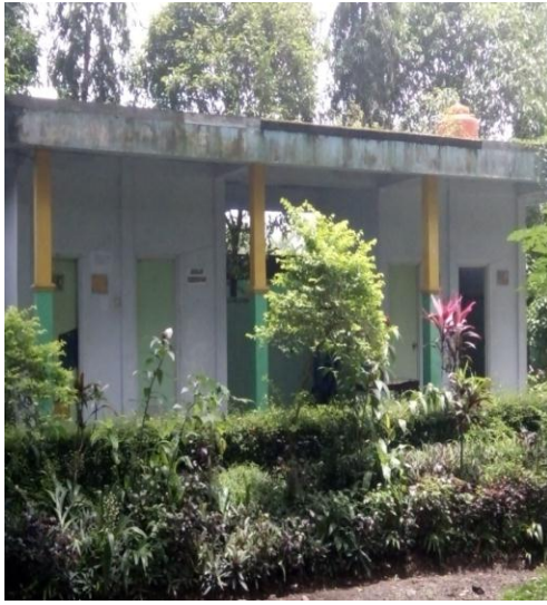
Kondisi Kamarmandi / toilet yang ada di Obyek Wisata Ngembag