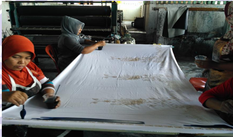
Proses Pewarnaan 1 Warna Dasar