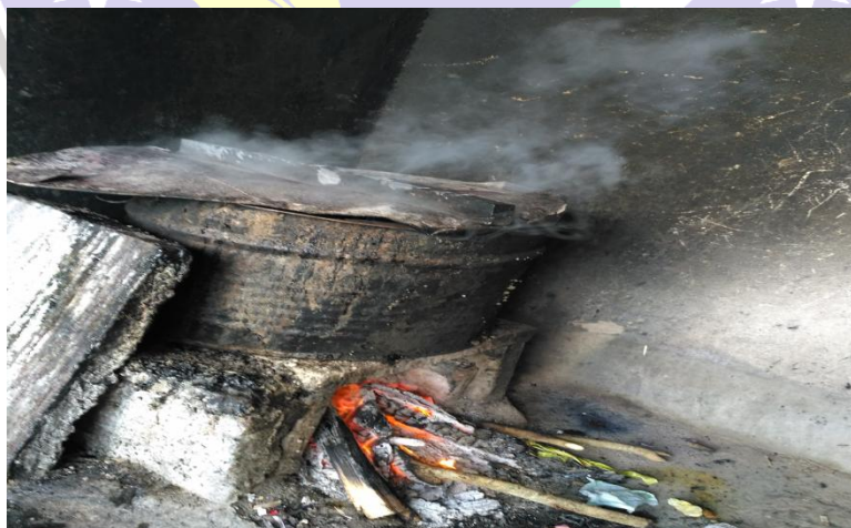
Perebusan Untuk Membersihkan Lilin