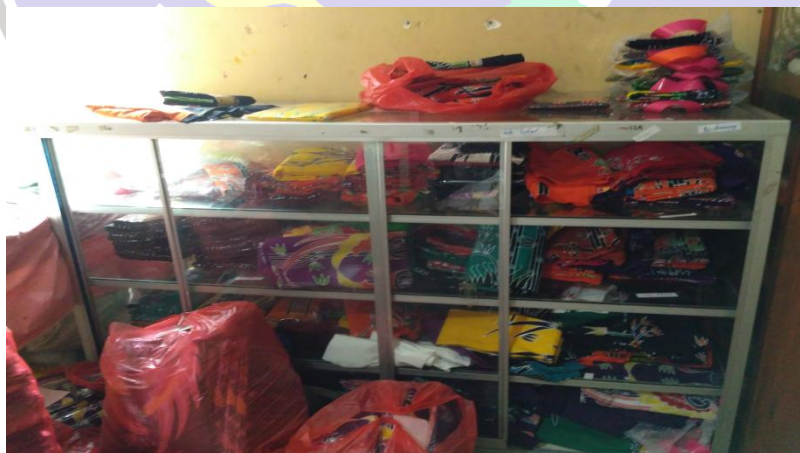
Batik Mukti Lestari