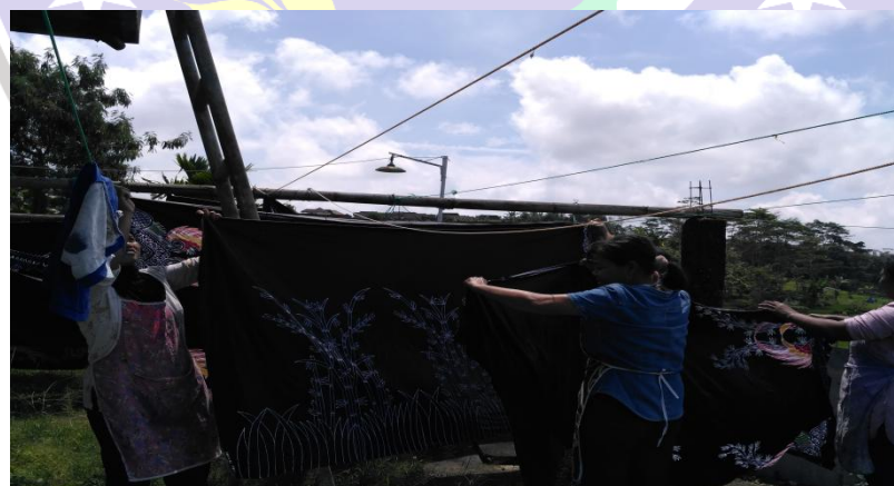
Pengeringan Batik Masih Mengandalkan Sinar Matahari