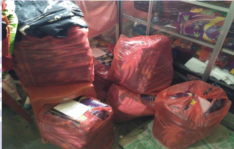
Pesanan yang sudah siap untuk dikirim