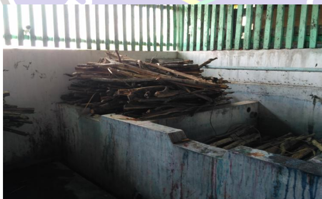
Kayu Bakar Untuk Merebus Batik