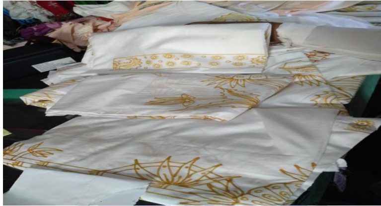
Kain Mori Yang Sudah Di Batik