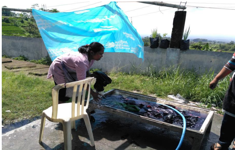
Proses Mencuci Batik Setelah Perebusan