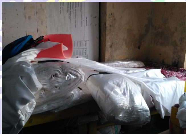
Kain Mori Premis dan Proplin