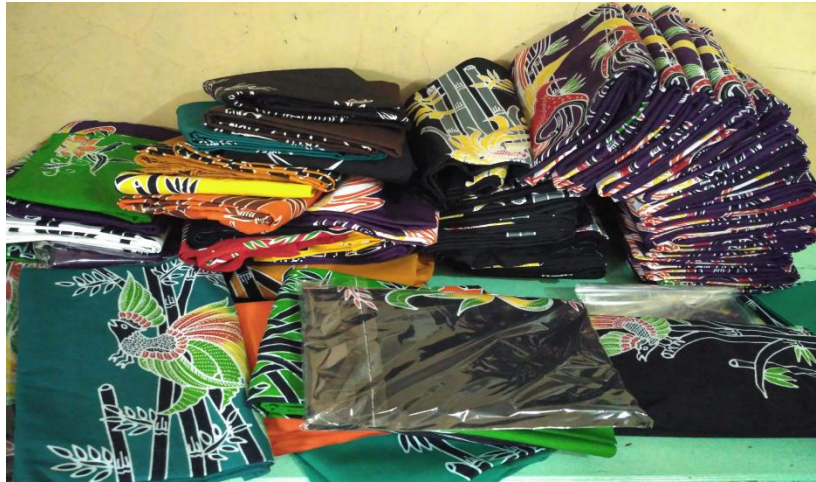
Hasil Kain Batik Mukti Lestari